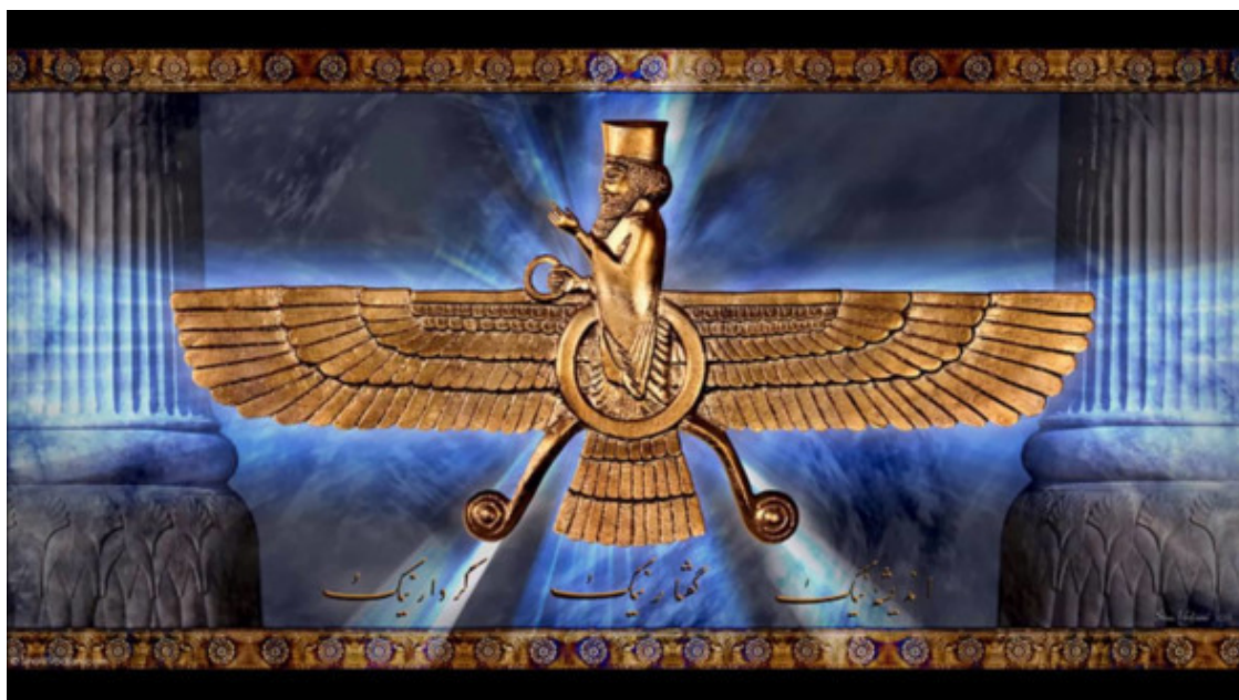
Ахура Мазда с приготовленными венцами

В изображениях этого бога в его руке зажаты кольца-венки для коронования новых сатрапов.