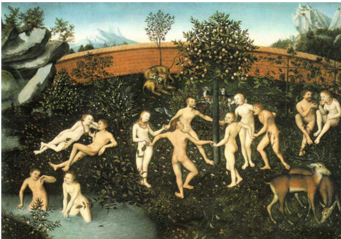
Золотой век. худ Кранах Старший (1472 – 1553)