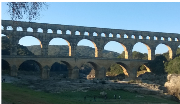
На фото: древнеримский Гарский мост, Франция

На обложке данной книги размещена часть фотографии с фрагментом старинного пиратского корабля «Галеон Нептун» на фоне набережной Генуи.