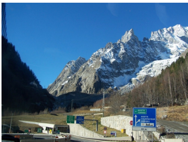
Ледник Brenva, кадр от смотровой площадки у тоннеля Мон-Блан, итальянская сторона

В северной Италии температура до -3^{\circ}\text{C} , долины припорошены снегом. К населённому пункту Ivrea погода меняется, становится теплее. Повсеместно проходим участки с туманами в низинах и у окраин лесов. Временами видимость хорошая: иногда выглядывает солнце и проясняется. После прохождения пункта Santia ( известный нам поворот на Милан ), уходим на юг, а в 12:46 снова делаем двадцатиминутную остановку, уже на ланч и кофе.