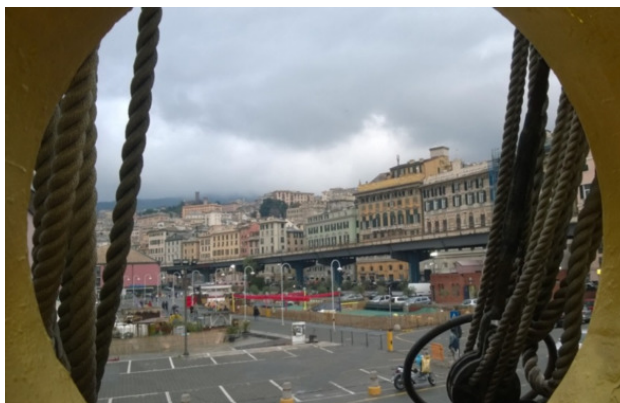
Вид на вечерний город с иллюминатора галеона, кадр с мобильного телефона, 25.12.2015

Генуэзский Аквариум мы посещали во второй вечер, 26 декабря. Хронология посещения достопримечательностей Генуи за 2 полных дня и 3 вечера, в дальнейшем, в моём рассказе не так важна. В день приезда обычно впечатляет окружающая природа, изменения погоды, перемена места, новые люди: оказываешься совсем в другом городе, не похожем на привычное место жительства ( что я последовательно выше и описывала ).