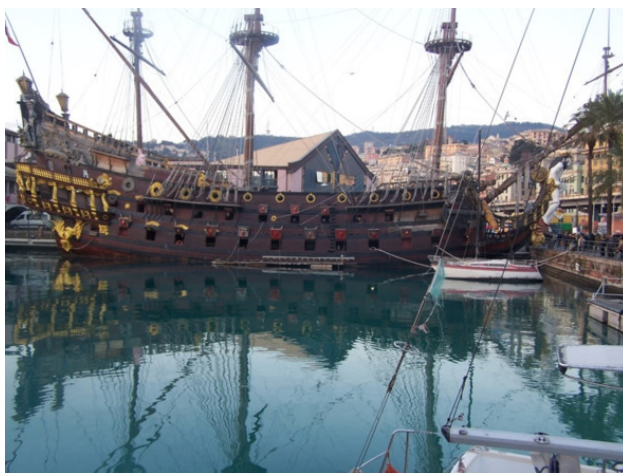
На фото: Neptun, кадр с фотоаппарата при солнце

На причале обращает на себя внимание старинный пиратский корабль Galeone Neptun (галеон Нептун). Это копия трёхпалубного испанского галеона XVII века, воспроизведённого в 1985 году для фильма «Пираты» Романа Полански. Ныне экспонат успешно привлекает туристов, в том числе и мы с удовольствием фотографировали его, поднялись посмотреть бутафорские атрибуты и обустройство трюмов. Стоимость входного билета (adulte) – 6 €.