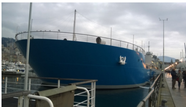
На фото – здание Аквариума в форме корабля

Здание Acquario di Genova — синего цвета, выделяется на набережной. Если пройти по прогулочному пирсу, вдающемуся в бухту, то видно, что Аквариум построен в форме корабля ( см. фото ниже, снимок вечерний ). Входные билеты в Аквариум продают рядом с его центральным входом, в огороженных кассах. Генуэзский аквариум один из крупнейших в Европе. Аквариум привлекателен для всех, особенно для семей с детьми. Очень понравились пингвины, дельфины, разнообразные экзотические рыбы (и рыбки), креветки, крокодилчики и чистота содержания всего заведения. Есть громадные аквариумы с акулами. А мурены уживаются с другими видами в одном из бассейнов. Отдельная экспозиция посвящена ареалам обитания в Тирренском море южных гладких китов и кашалотов .