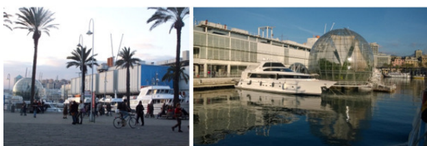
На фото: Набережная Генуи: Аквариум и Биосфера

Видно, что прошёл тёплый дождь, температура воздуха около +14°C. Солнце немного проглядывает сквозь облака, но уже клонится к закату. На набережной давно распознали Аквариум и другие достопримечательности, которые мы изучали заочно. Но нужно всё рассмотреть, подышать морским воздухом. Здесь многолюдно, настроение у людей праздничное. Начинают зажигаться новогодние люминисцентные ёлки, установленные рядом с высокими пальмами, отчего зрелище – экзотичное.