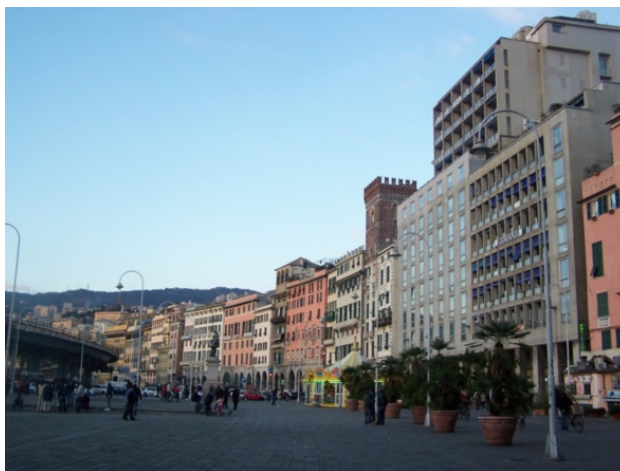
На фото: Набережная Генуи, декабрь 2015

Бронируя отель, надо внимательно смотреть условия о предоставлении парковки (это относится и ко всем условиям договора, но об этом позже.). На сайте отеля было написано: «общественная парковка за дополнительную плату – 18 € в день» (а не в сутки, как следовало бы указать). Скидки отель не обещал. При оплате паркинга за трое суток автомат показал цену – 108,20 €, т.е., соответственно, за сутки 18 € x 2. Если бы обратили внимание своевременно на формулировку «...в день», то забронировали бы отель подороже, где паркинг бесплатный. В настоящее время цену паркинга администрация отеля Genziana не указывает вовсе. Надо заметить, что ранее указываемые на сайте 18 € – это вовсе не мало, если даже было бы за сутки.