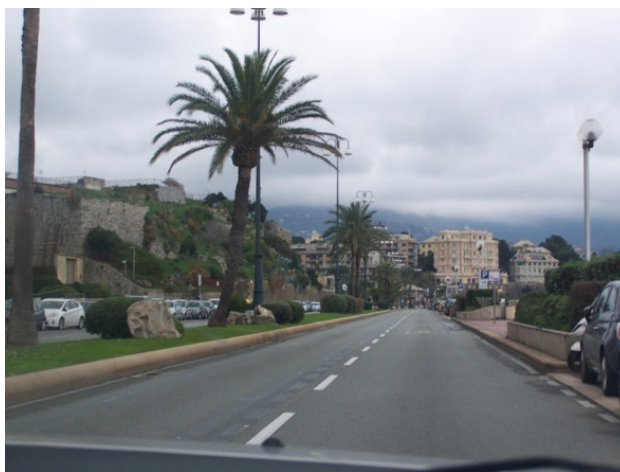
Въезжаем в Геную

Очень захватывающе наблюдать на скорости за панорамой: многоуровневые улицы внизу и на высоте горных склонов, с красивейшими строениями; пальмы разнообразных видов; Лигурийский залив , бухты, яхты, корабли – и всё это под солнечными лучами, пробивающимися, в уносящихся облаках. Так, в динамике в пути, с высоты трассы, в условиях меняющейся погоды, пред нами открылась жизнь неведанного нами ранее старейшего портового города.