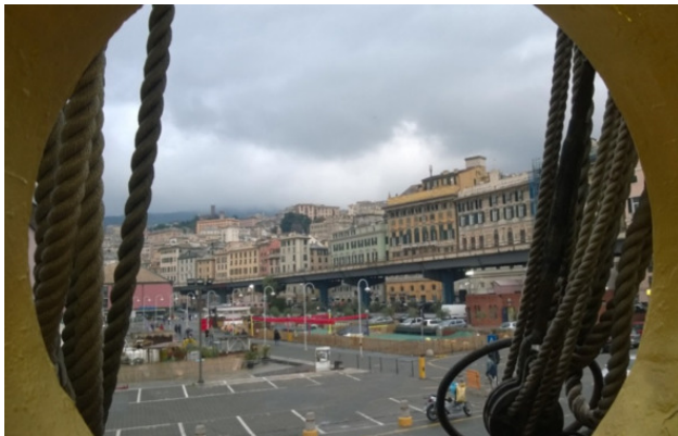
Вид на вечерний город с иллюминатора галеона, кадр с мобильного телефона, 25.12.2015

Генуэзский Аквариум мы посещали во второй вечер, 26 декабря. Хронология посещения достопримечательностей Генуи за 2 полных дня и 3 вечера, в дальнейшем, в моём рассказе не так важна. В день приезда обычно впечатляет окружающая природа, изменения погоды, перемена места, новые люди: оказываешься совсем в другом городе, не похожем на привычное место жительства ( что я последовательно выше и описывала ).