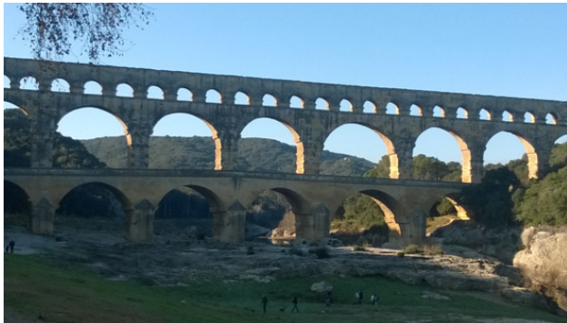
На фото: древнеримский Гарский мост, Франция