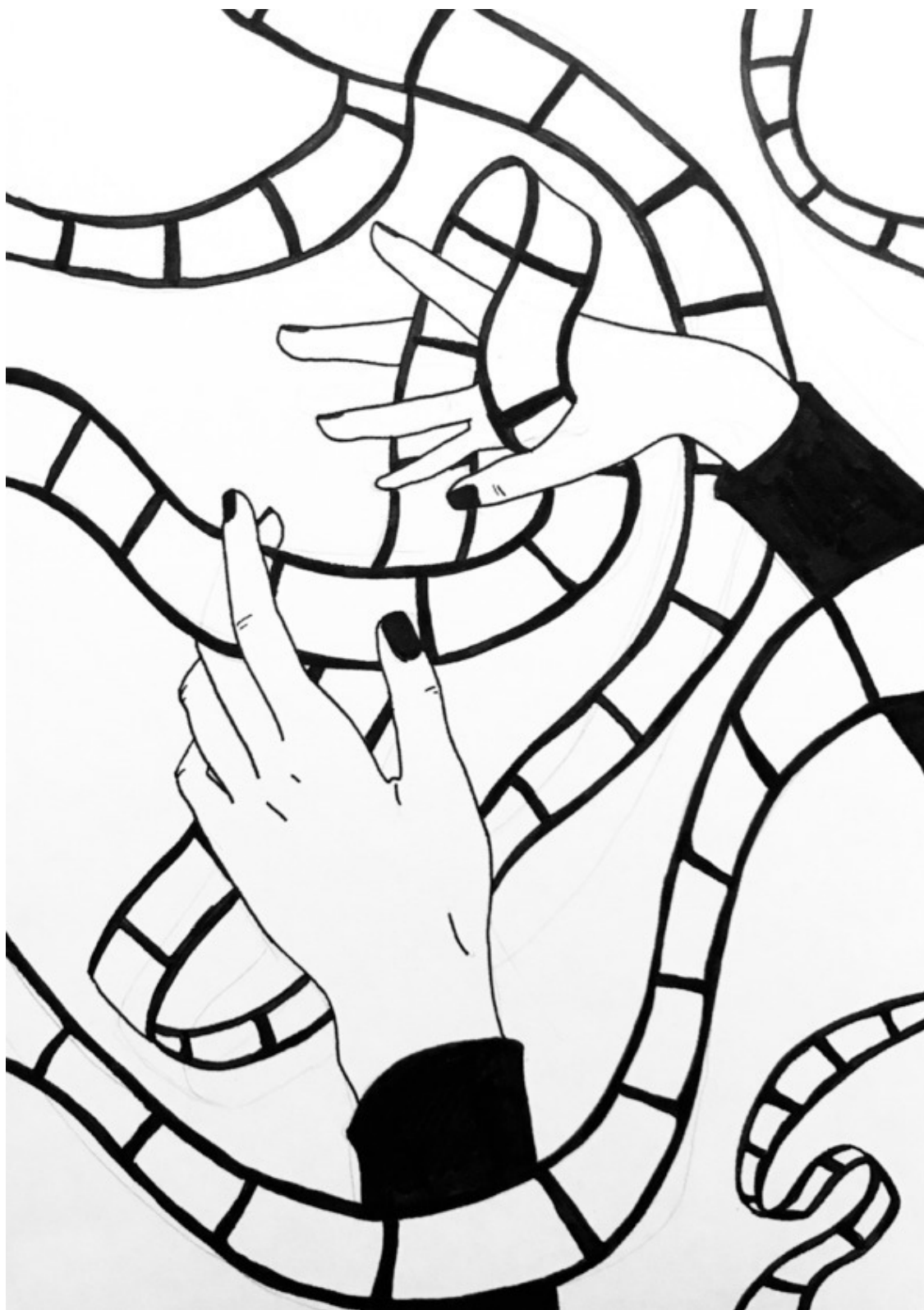
Иллюстрации от Леры Райс