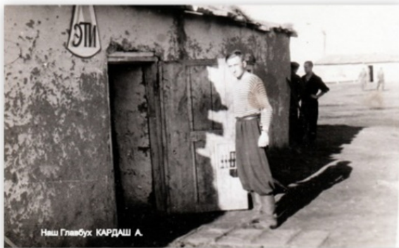
Наш Глибух. КАРДАШ А.