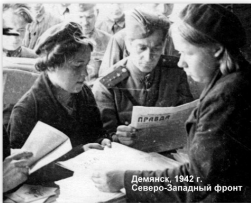
Демянск, 1942 г. Северо-Западный фронт