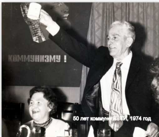
50 лет коммунизму, 1974 год