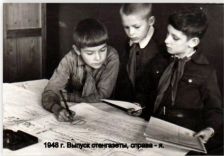
1948 г. Выпуск стенгазеты, справа - я.

Все его яркие качества: целеустремленность, организованность, стойкая жизненная позиция в полной мере передались его детям. У каждого из них, Леши и Коли, по трое