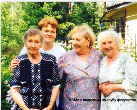
МАМА с подругами по клубу флористов