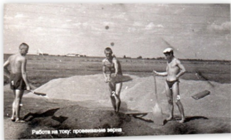
Работа на току: промывание зерна