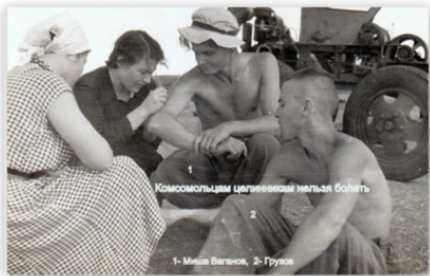
Комсомольцами целенаправленно нельзя болеть