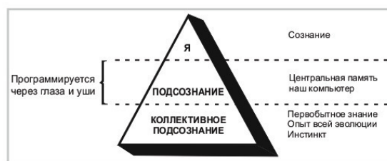
Рисунок 2: Психологический треугольник

Для того, чтобы жить счастливо, физические и душевные силы должны гармонично поддерживать нашу сознательную волю. Это ясно показывает, как физическое и душевное состояние могут способствовать, или препятствовать друг другу. Тело влияет на душу, душа – наше подсознание – влияет на тело. Таким образом, подсознание в значительной степени зависит от того, здоровы мы или больны. Поэтому, давайте мы обратим наше внимание на состояние нашей души, которое также определяет направление нашей жизни. Психологический треугольник лучше всего иллюстрирует структуру сознания. Верхний маленький треугольник – это наше «я», наше суждение и критичность. Многие люди считают, что этот маленький треугольник является единственным целым. При этом он виден только в виде небольшой части. Основное содержание, оно как у айсберга, невидимо.