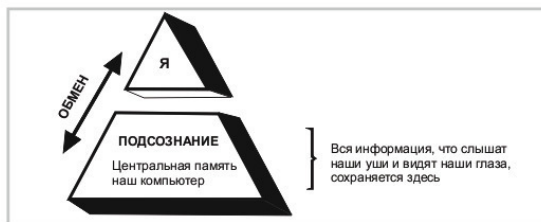
Рисунок 3: ОБМЕН ИНФОРМАЦИЕЙ

На приведенном выше рисунке понять положительное и отрицательное влияние. Маленький верхний треугольник – это наше сознательное «я». Снизу – это наша память. Оба связаны друг с другом. Чтобы понять принцип работы, приведем пример: