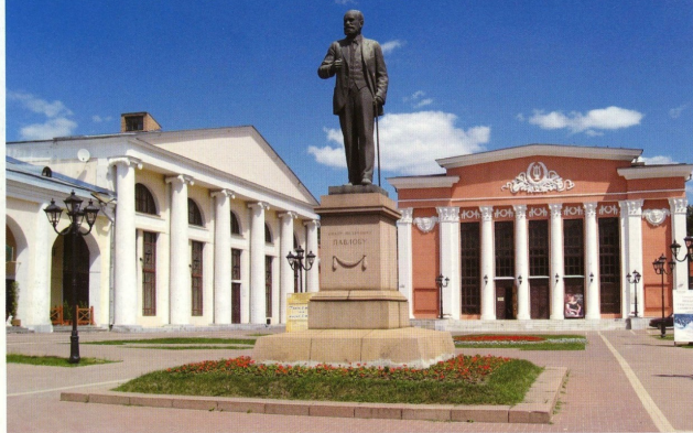
Памятник академику И.П. Павлову и концертный зал имени С.А. Есенина