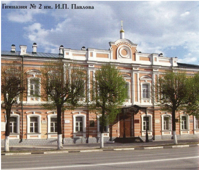
Гимназия № 2 им. И.П. Павлова