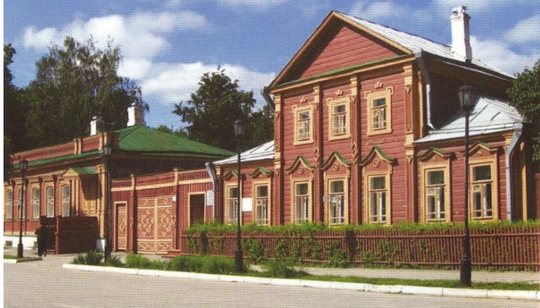
Музей-усадьба академика И.П. Павлова

Дом стал музеем 6 марта 1946 года. Его открытие было приурочено к проходившей в Рязани выездной сессии Академии наук СССР, посвященной 10-летию со дня смерти ученого. Из документов, фотографий, книг, вещей воссоздана обстановка, которая была в доме в годы жизни всемирно известного физиолога. Музей экспонирует личные вещи И. П. Павлова, копии его рукописей, диплома и золотой медали лауреата Нобелевской премии, которой он был удостоен в 1904 году, оригинал бюста И. П. Павлова, выполненного С. Т. Коненковым в 1929 году в Америке, где ему позировал ученый.