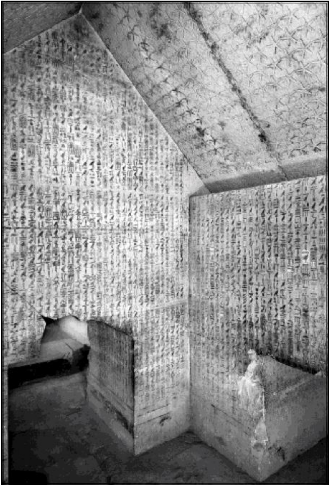
«Тексты Пирамид» на стенах погребальной камеры пирамиды фараона Унаса (прав. припл. в 2375–2345 гг. до н. э.; V династия)

В подтверждение обозначенной заголовком идеи автор хотел бы начать данный материал с мнения А. А. Зализняка из его работы «Лингвистика по А. Т. Фоменко»: «У гуманитария