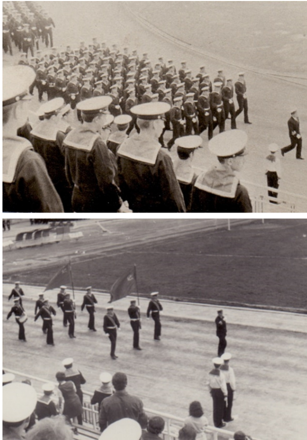
Тренировки на стадионе