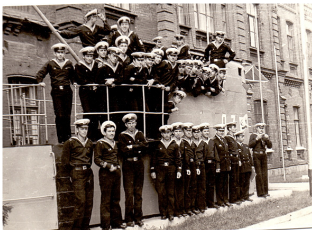
На практике на базе подводных лодок в Лиепае, 1975 год