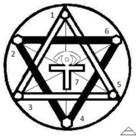
рис. 1 Гексаграмма с активным центром в круге Жизни как символ взаимодействия 7 законов Мироздания

formalis» была помещена в Empyreum Бога, показав лучи божественного света, в то время как основа «pyramidis materialis» была расположена на Земле, указывающей вверх на Бога, с Солнцем в центре, уравновесившим возрождение Духа. Гексаграмма в Индуизме трактуется и как энергетический двигатель, который наделяет собой силой и волей к существованию как индивида, так и всю Вселенную. В Египте и Финикии гексаграмма считалась символом равновесия женского и мужского, материального и духовного начал, человеческого (треугольник, направленный концом вниз) и божественного (треугольник, обращенный концом вверх). Из подобных шестигранных структур состоят, например, уникальный в природе фуллерен , пчелиные соты и снежинки.