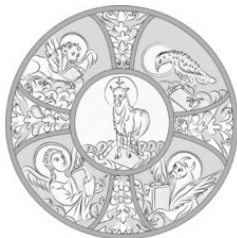
Рис. 5 Иллюстрация из «Евангелия» от Матфея

1.7.5. Сердцевина личности («Жемчужина») – « Агнец » на рис. 5, « коробочка » Лотоса в Египте, след результата жизни индивида, «божественная» природа, связанная с 4 чакрой.