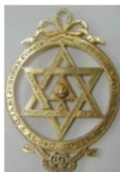
рис. 3 Гексаграмма масонов

«Если бы вы знали великолепие цифр 3, 6 и 9 , у вас был бы ключ к Вселенной» – писал Никола Тесла . Если же представить, что круг на рис. 1 разделен на 24 сегмента и, поместив в узел 1 цифру 0 (или 9), начнем далее по этим сегментам строить ряд Фибоначчи с «нумерологическим» сложением последовательных цифр в сегментах, соответственно, получится, что аналогам узлов с 1 по 6 на рис. 1 будут соответствовать цифры 3, 6 и 9 (9= узел 1 и 4, 6= узел 2 и 3, 3= узел 5 и 6), задающие два пересекающихся треугольника на рис. 2.