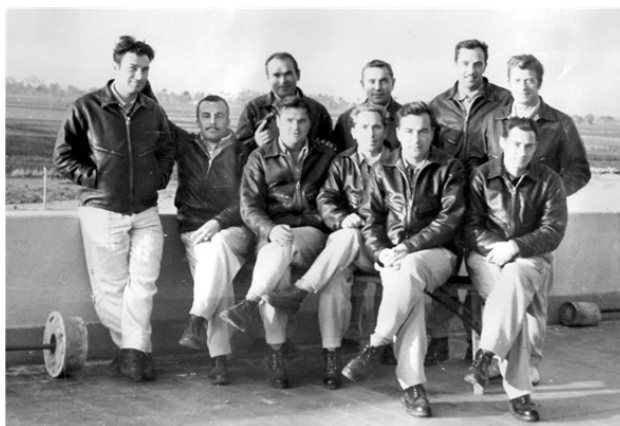
Летчики 2 эскадрильи 135 истребительного полка. Каир. 1970 год

Посмотрели фотографии, хотя с этим было тоже строго: командировка была засекречена – все давали подписку.