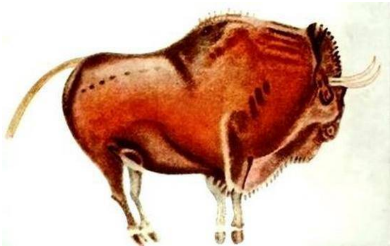
Рис. 2. Пещера рук (Куэва-де-лас-Манос). Аргентина, IX тыс. до н. э. (а); Бык (фрагмент из пещеры Альтамира). Испания, XV–VIII тыс. лет до н. э. (б)

Кроме названных, существуют и другие интересные гипотезы происхождения изобразительного искусства, например, трудовая гипотеза (А.П. Окладников), гипотеза фоссенов (связывает возникновение искусства с воспроизведением образов, естественно возникающих у человека в темноте при надавливании на глаза, а также с образами галлюцинаций в условиях недостаточной зрительной стимуляции), психофизиологическая гипотеза (искусство как результат межполушарного взаимодействия) и др. В своей совокупности они служат обоснованием фундаментальной связи между ху-