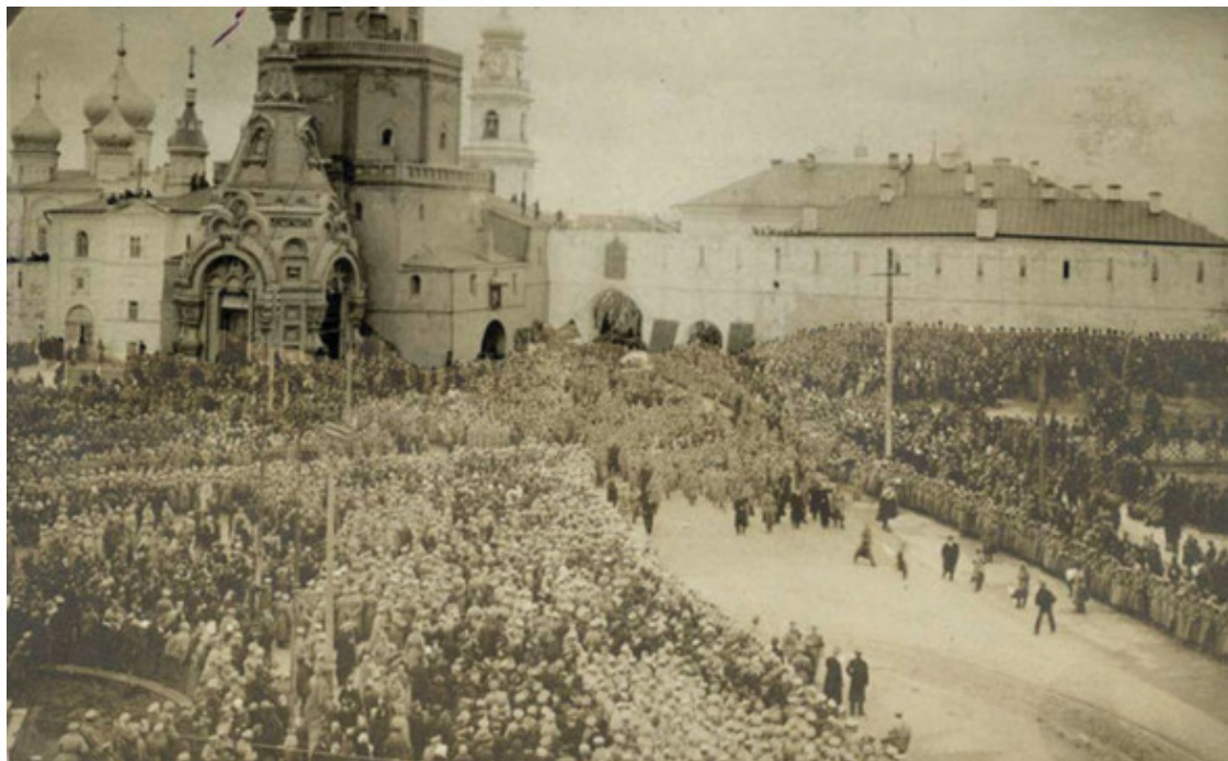
Манифестация в поддержку временного правительства в г. Казани, 2 марта 1917 г.