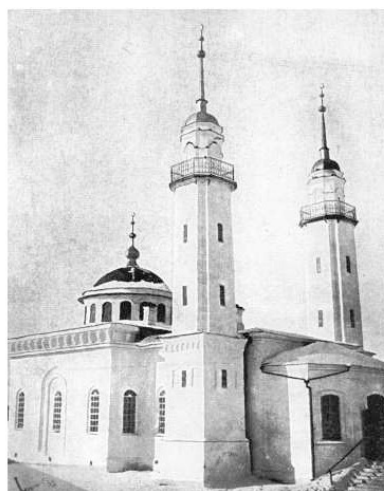
Вторая соборная мечеть г. Троицка, начало XX в.