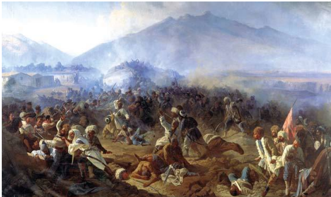
Штурм Ахты. 1848. Бабаев П.

В 1917 году в России свергли царя, происходит революция, в результате которой был создан Союз Советских Социалистических Республик (СССР). А в 1992 году СССР распался на 15 государств. Часть земель, где проживали лезгины, осталась в России, а другая часть – в Азербайджане. Граница между Россией и Азербайджаном частично проходит по реке Самур.