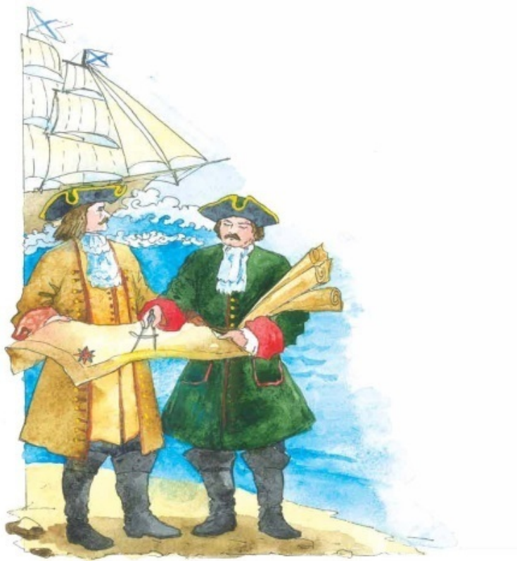
Фёдор Иванович Соймонов, первый русский картограф