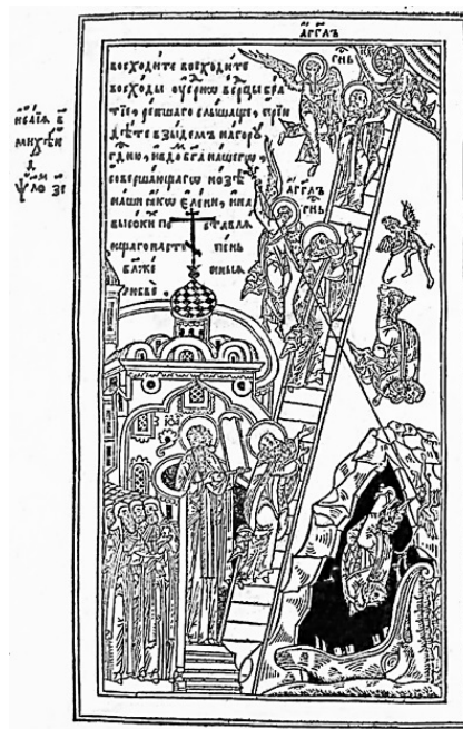
Иллюстрация из рукописи 1647 г.