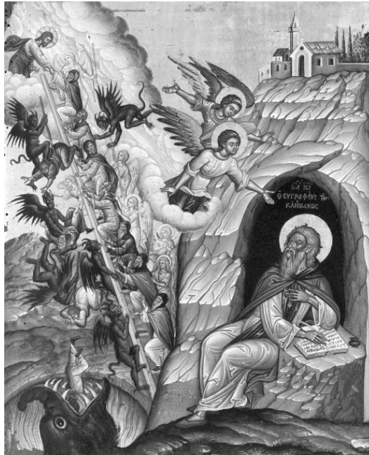
Преподобный Иоанн Лествичник, игумен Синайской горы. Современная греческая икона