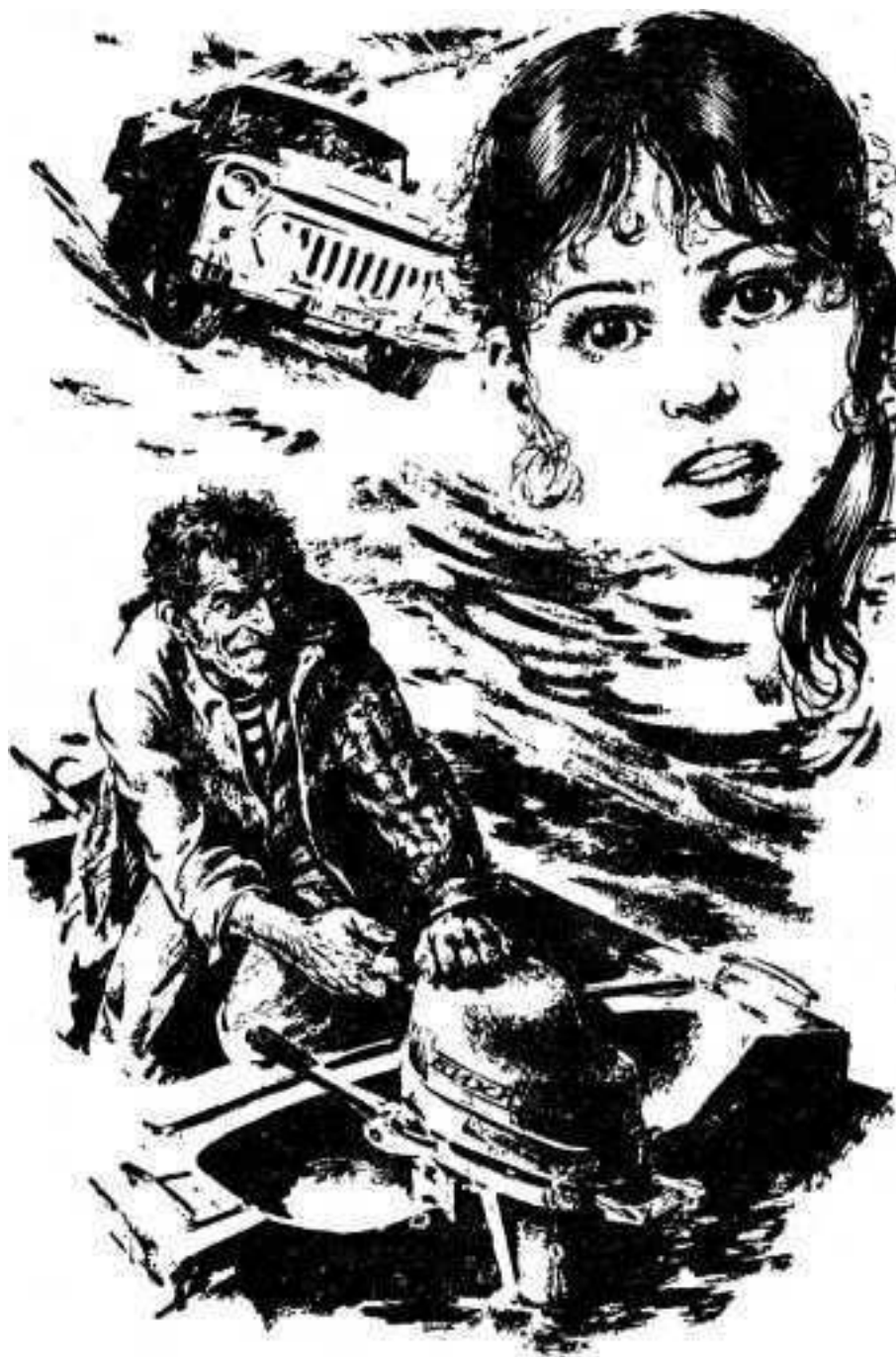
Рисунок для рассказа «У золотой карги», подаренный Виктору Петровичу Астафьеву

Встретил и неожиданно красивую эвенкийку в поселке Тура. Она сидела на завалинке и курила, будучи слегка навеселе. Наделал комплиментов и уговорил на портрет. Сказала, что приехала повидать родителей, учиться в красноярском «педе».