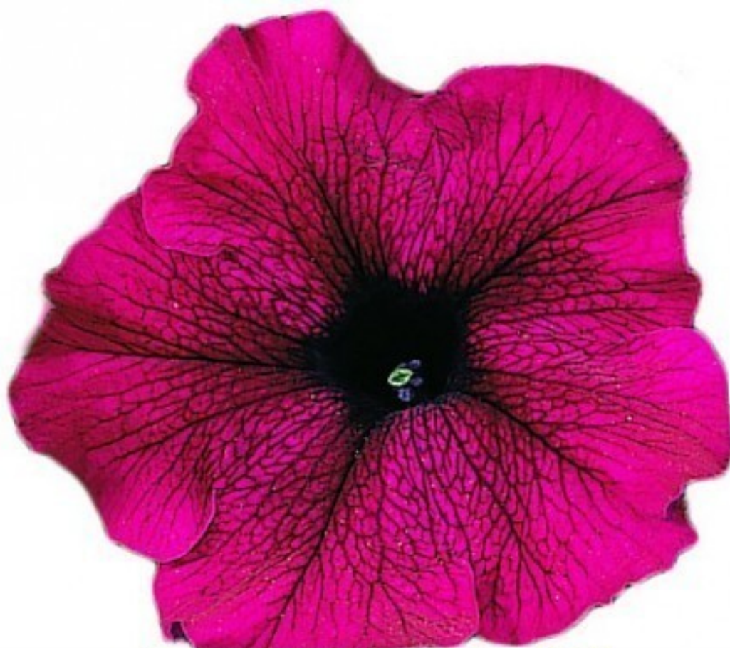
ЦВЕТОК ПЕТУНИИ FALKON BURGUNDY

Почему-то многие наши покупатели любят именно эту расцветку и, если, допустим, покупают 10 синих, 10 белых и так далее, то Бургунди берут в два раза больше!