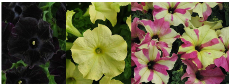
СОФИСТИКА Ф1 ОТ ФИРМЫ-ПРОИЗВОДИТЕЛЯ СЕМЯН PAN AMERICAN