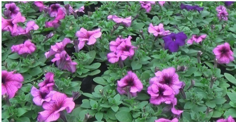
ОДНА ИЗ РАСЦВЕТКОВ ВИРТУОЗО – PLUM

Так же у Китано есть ещё три интересных серии петунии: Кобаяши – карликовая серия с гофрированными цветками.