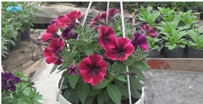
ПЛЕТИ КАСКАДНОЙ ПЕТУНИИ ВНАЧАЛЕ РАСТУТ ВВЕРХ

Соцветия и у ампельной, и у каскадной петунии бывают простые и махровые, длина плетей в зависимости от сорта может достигать при правильном уходе и формировании полутора метров, но достичь такой длинны очень непросто!