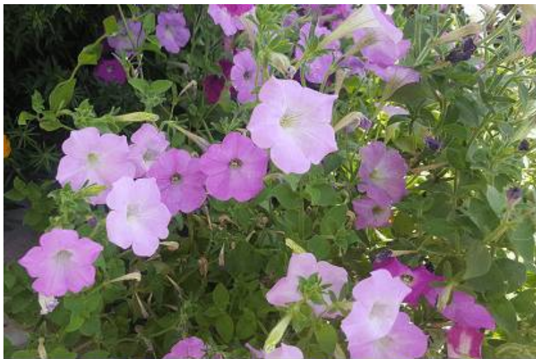
ПЕТУНИЯ, НАЗЫВАЕМАЯ В НАРОДЕ «ПРОСТЯЧКА»

Первые два сезона в те далёкие годы мы выращивали петунию, в народе называемую «простячка», – бледные расцветки, непонятной формы потянутые кустики, цветочки мелкие, в общем, по нынешним временам и ассортименту – никакая!