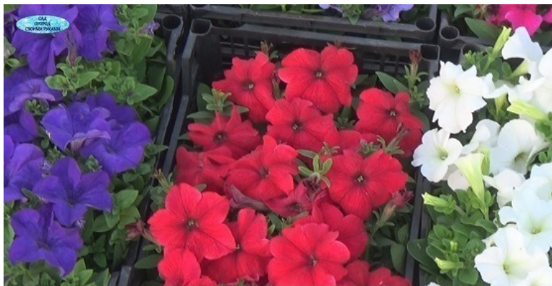
ПЕТУНИЯ КУСТОВАЯ ВИРТУОЗО

мультифлора – это тоже кустовая петуния, но диаметр цветка у неё меньше, чем у грандифлоры, примерно 5-7 сантиметров. Соцветия тоже могут быть простыми и махровыми.