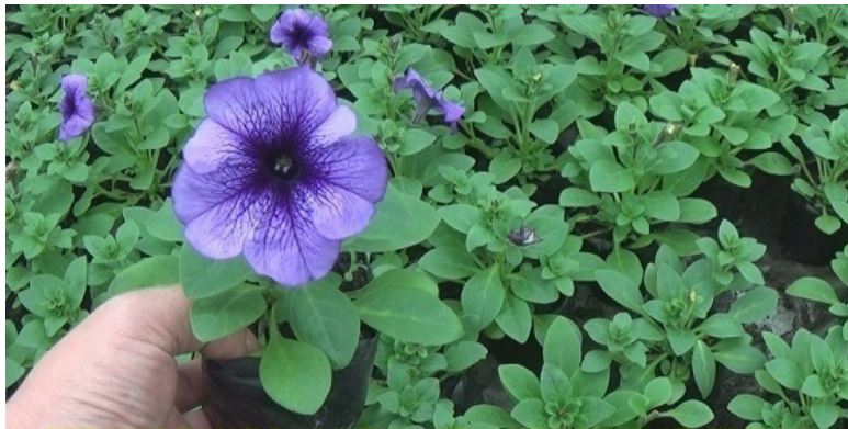
ПЕТУНИЯ EAGLE PLUM VEIN – ОДНА ИЗ САМЫХ КРАСИВЫХ РАСЦВЕТОВ В ЭТОЙ СЕРИИ

Серия Falcon тоже имеет порядка девяти расцветок, среди которых по привлекательности особо хочется выделить Falcon Burgundy :