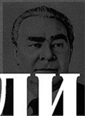
БРЕЖНЕВ Член Политбюро ЦК КПСС, Генеральный секретарь ЦК КПСС

На тоне «Казачка», вблизи хутора Рогожкино, рыбаки бригады Н. Бородового вынули из сетей редкий «подарок» Дона — гигантскую белугу весом в 336 килограммов. В ней оказалось 60 килограммов икры.