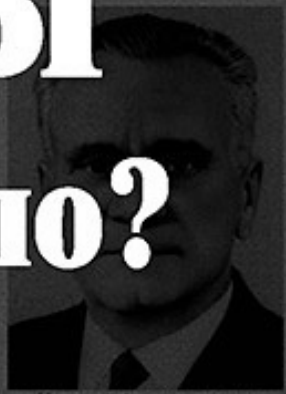
Николай Александрович ТИХОНОВ Член Политбюро ЦК КПСС