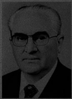
Юрий Владимирович АНДРОПОВ Член Политбюро ЦК КПСС