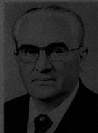
Юрий Владимирович Андропов Член Политбюро ЦК КПСС