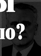
Николай Александрович Тихонов Член Политбюро ЦК КПСС