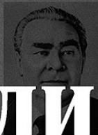
Леонид Брежнев Член Политбюро ЦК КПСС

На тоне «Казачка», вблизи хуто- ра Рогожкино, рыбаки бригады Н. Бороодового вынули из сетей ред- кий «подарок». Дюна — гигантскую белугу весом в 336 килограммов. В ней оказалось 60 килограммов икры.