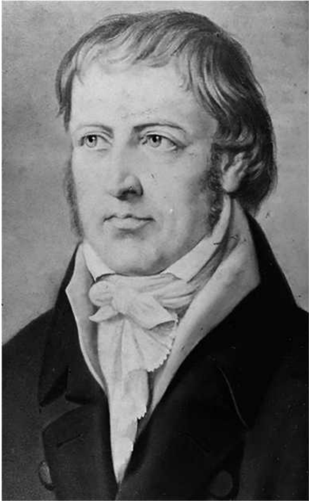
Георг Вильгельм Фридрих Гегель 1770–1831