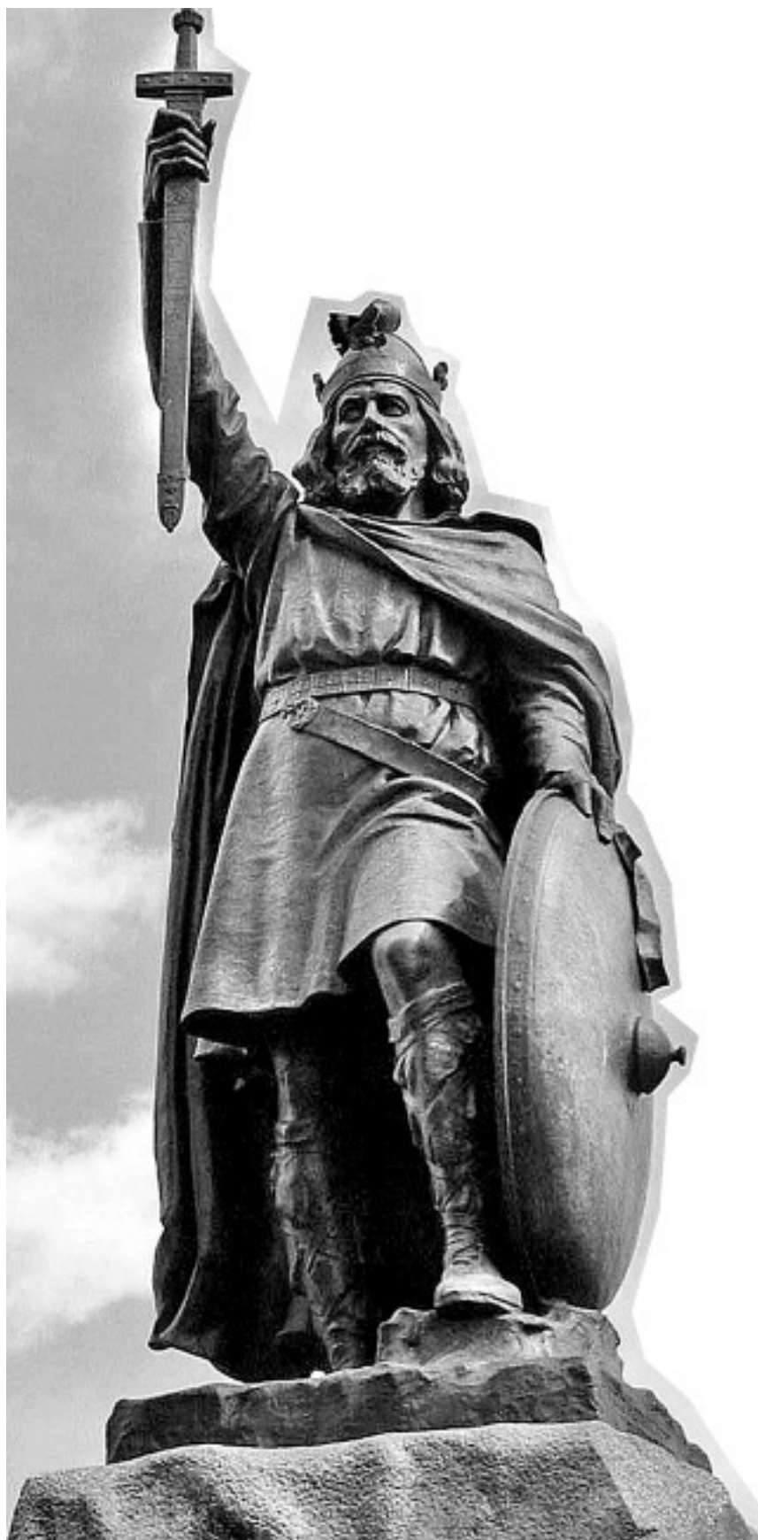
Хамо Торникрофт. Статуя Альфреда Великого, управлявшего королевством Уэссекс в 871–899 годах. Уинчестер