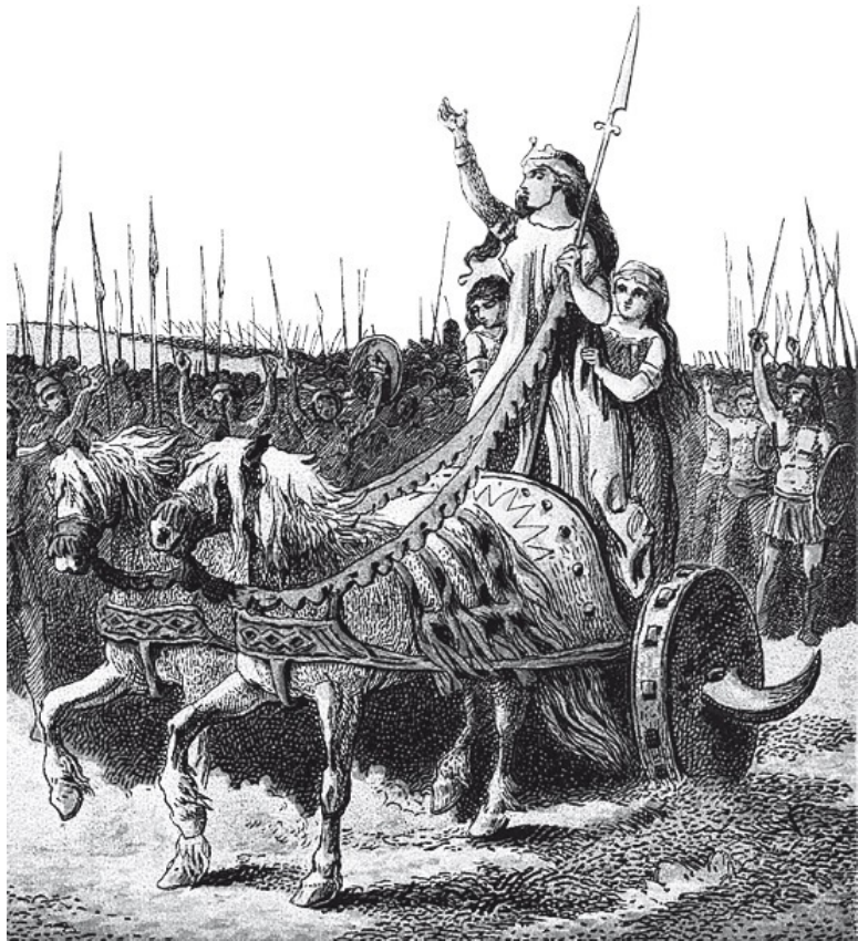
Джозеф Мартин Кронхейм. Будикка, лидер восстания против римлян. Гравюра. 1868

Историк Тацит в «Анналах» говорит о том, что кельтские женщины и друиды потрясли римских солдат.