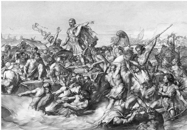
С рисунка сэра Эдварда Армитиджа. Первое вторжение Цезаря в Британию. Ок. 1843

В обоих случаях Цезарь не оставил в Британии постоянных римских гарнизонов. Римляне начали настоящее завоевание Британии лишь при императоре Клавдии, уже в 43 году нашей эры, и это им успешно удалось.