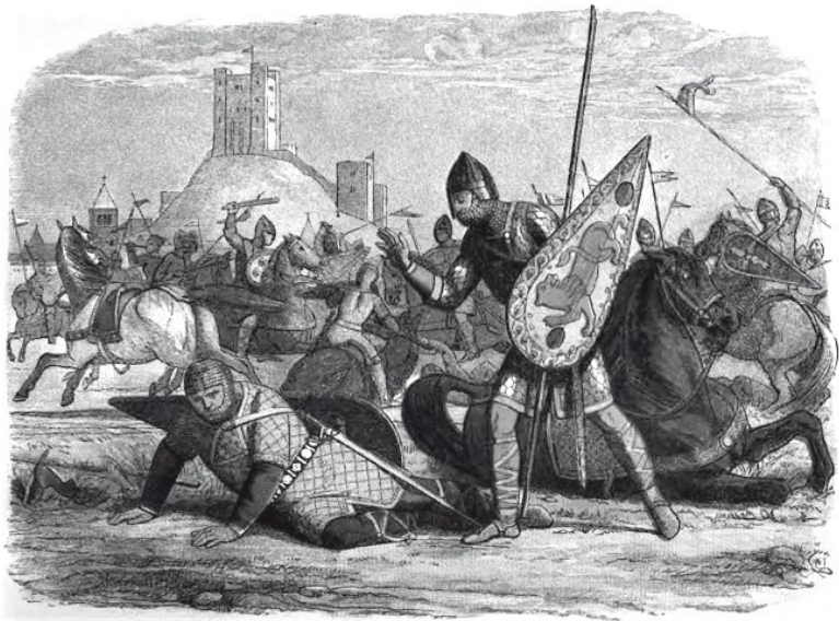
Эдмунд Эванс по картине Джеймса Дойла. Роберт Куртгёз ранит своего отца. Гравюра. 1864

Вообще, кроме многих дочерей, Вильгельм имел трех сыновей: Роберта, Вильгельма и Генриха. Старший из них, по причине коротких ног был прозван Куртгёзом (Courteheuse – Короткие штаны). Являясь наследником англонормандской державы, одного из сильнейших государств Западной Европы, он не обладал реальной властью при жизни отца, и это бесило его. Он постоянно конфликтовал со своими братьями, пытался захватить Руан. Потом он примирился с отцом и в 1080 году даже возглавил английское вторжение в Шотлан-