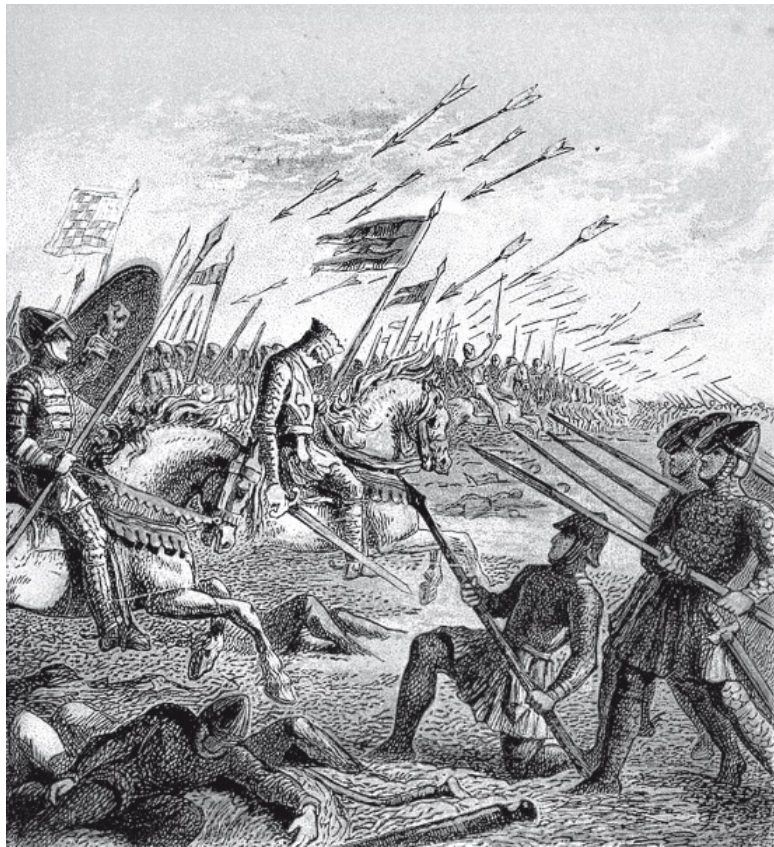
Джозеф Мартин Кронхейм. Битва при Гастингсе. Гравюра. 1868

Под Вильгельмом была убита лошадь. Видевшие падение герцога успели подумать, что он убит. Но герцог поднялся