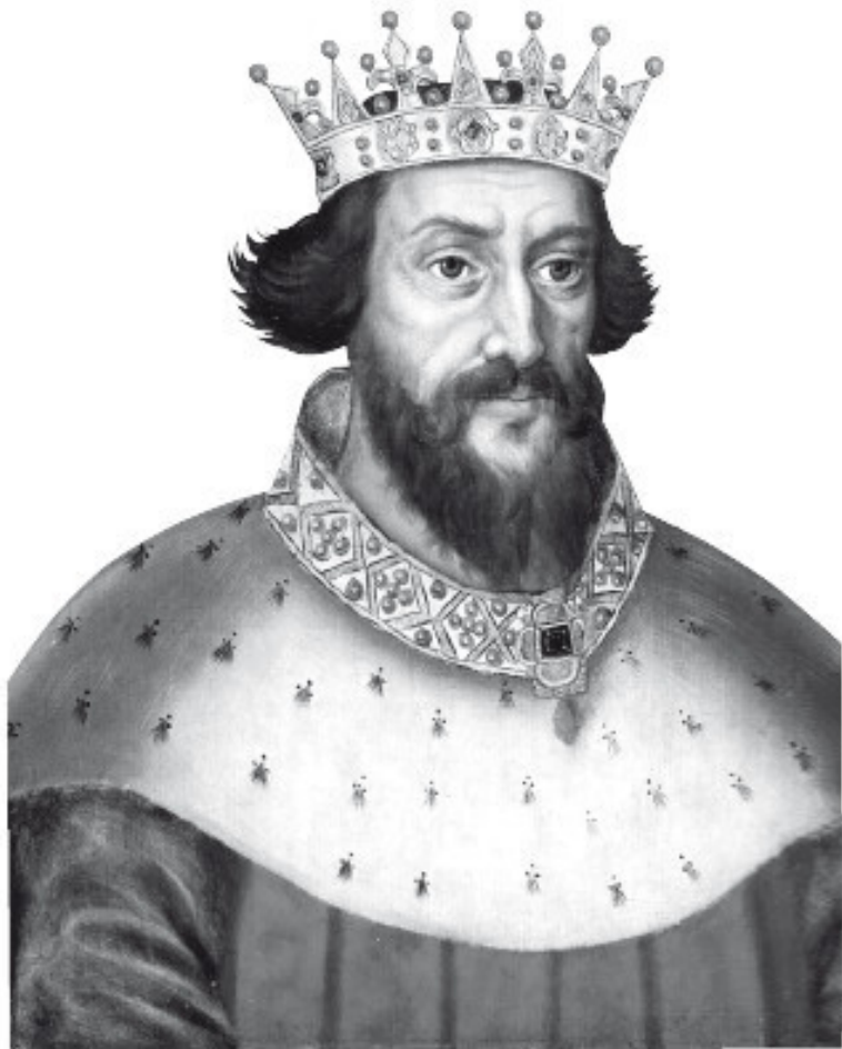
Неизвестный автор. Король Генрих I. Ок. 1620. Наци-