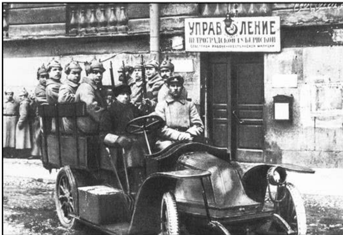
«Губрозыск занимал здание старинного купеческого особняка...»