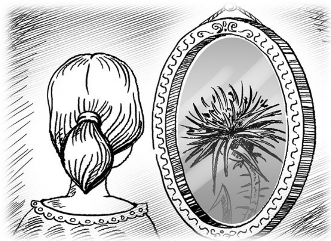
Рис. 2. Зеркало для Любы

Ребенок познает себя через мнения окружающих его людей. Поэтому отсутствие обратной связи губительно для его воспитания.