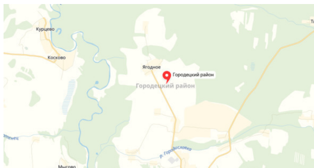
Деревня Оголихино на карте Городецкого района

По ревизской сказке 1782 года числится только одна семья с фамилией. Это Кувтыревы. В ревизии 1834 года появляется семейство Шишовых из д. Попово, причисленные в 1817 году. По сведениям фонда Р 124 оп. 4 дело 157 «Карточки с/х и поземельной переписи за 1917 г. Балахнинский уезд Смольковская волость волость» д. Оголихино (листы 900—910) записаны крестьяне с фамилиями: Лоднев, Прытков, Шишов, Евстигнеев, Ситов.