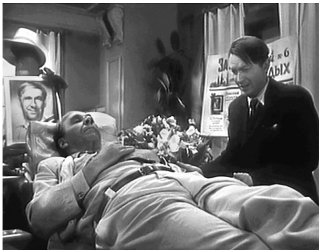
Ростислав Плятт и Георгий Вицин в первой кинокомедии Леонида Гайдая «Жених с того света»

Фильм получился остросатирическим, едко и зло высмеивающим бюрократов. Но именно эта сатира и не понравилась министру культуры Михайлову. Вызвав к себе Ромма, он с нескрываемым раздражением заявил: «Теперь-то мы знаем, чем вы занимаетесь в своей мастерской!» После этого randevу фильм приказали сократить вдвое, и Гайдай, чуть ли не рыдая, взял в руки ножницы. Мастерскую Ромма закрыли, и Михаил Ильич какое-то время вообще перестал появляться на «Мосфильме».