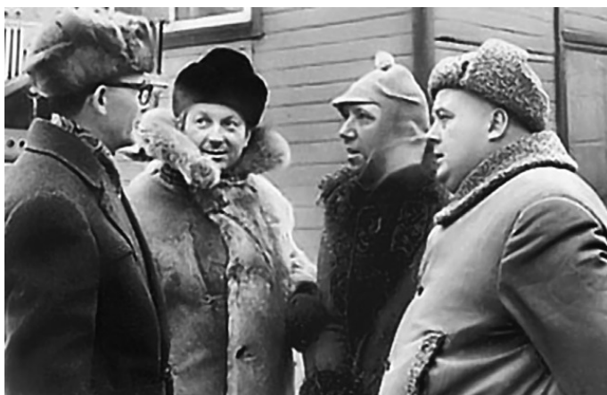
Леонид Гайдай со своими неразлучными героями на съемках «Самогонщиков». 1961 г.

Та же участь постигла и другой эпизод – с яйцами. В нем троица поодиночке прыгает с горки на шоссе, где сидит старуха с корзиной, в которой сложены яйца. Каждый из троицы приземляется аккуратно в нескольких сантиметрах с корзиной, причем когда прыгает последний – Балбес, – зритель должен находиться в предвкушении, что уж этот точно упадет на корзину. Но Балбес повторяет судьбу своих товарищей. Но, пробежав несколько метров, он возвращается на горку, снова прыгает вниз и на этот раз давит яйца.