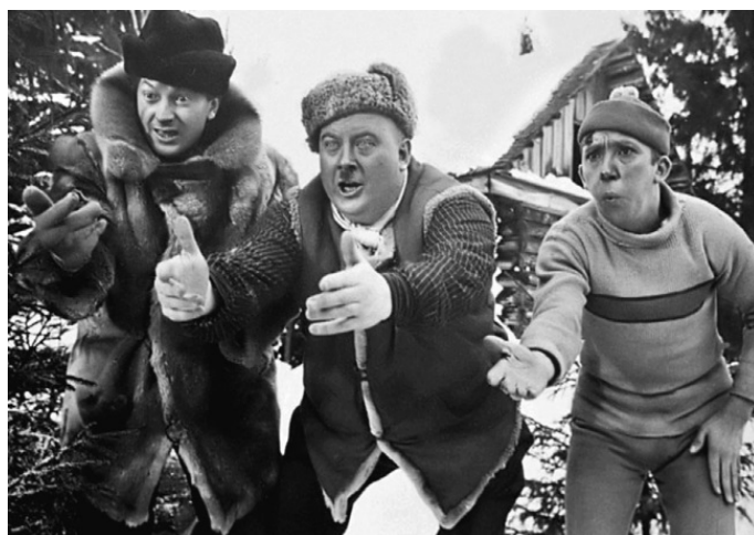
Трус, Балбес и Бывалый в фильме «Самогонщики»

Так получилось, но «Самогонщики», которые вышли на широкий экран в январе 1962 года, имели меньший успех, чем «Пес Барбос», хотя его закупили 68 стран, что принесло государству 70 миллионов рублей («Пса...», как мы помним, купили более ста стран). Причину подобного Ю. Никулин видел в следующем: «Самогонщики» во многом строились на применении старых, уже использованных приемов. Кроме того, «Самогонщики» шли двадцать минут, а «Пес Барбос» длился около десяти минут и воспринимался как короткий анекдот».