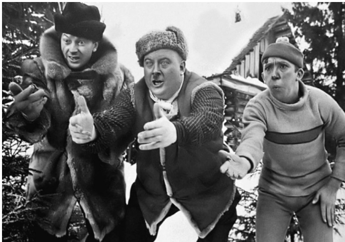
Трус, Балбес и Бывалый в фильме «Самогонщики»

В том году, как и в прошлом, новых отечественных кинокомедий вышло мало – всего лишь девять. Лучшими среди них были: «Гусарская баллада» Эльдара Рязанова (2-е место – 48,64 млн.), «Девчата» Юрия Чулюкина (5-е место – 34,8 млн.), «Взрослые дети» Вилена Азарова (7-е место – 28,7 млн.), «Семь нянек» Ролана Быкова (9-е место – 26,3 млн.), «Нахаленок» Евгения Карелова, «Приключения Кроша» Генриха Оганесяна.