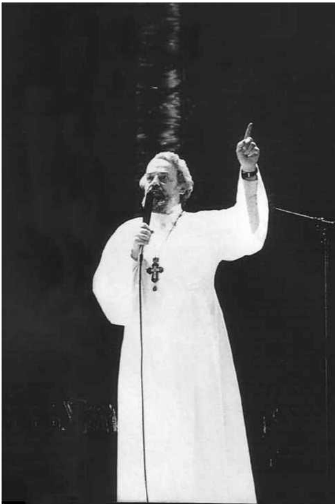
Протоиерей Александр Мень