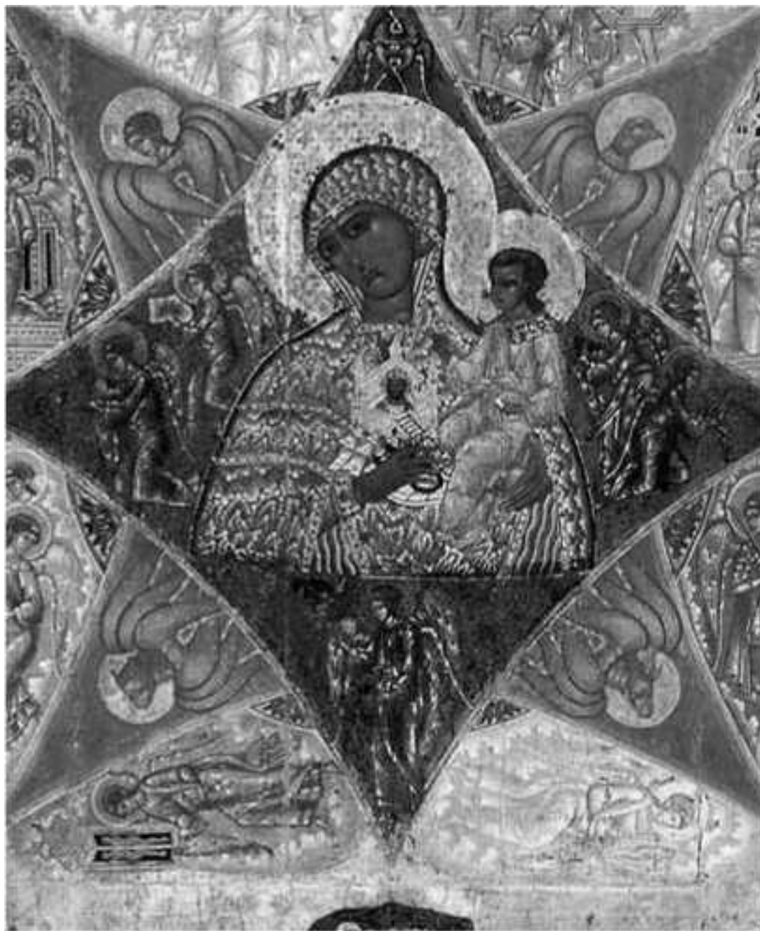
Икона Божией Матери «Неопалимая купина». Конец XVI века. Соловецкий монастырь

Моисей хочет знать: кто этот таинственный голос, который его призывает? Он спрашивает: «Кто ты?» И голос ему отвечает: «Эхьё Аиёр Эхьё», то есть «Я Тот, Кто Есть», «Я Тот, Кто Существует»!..