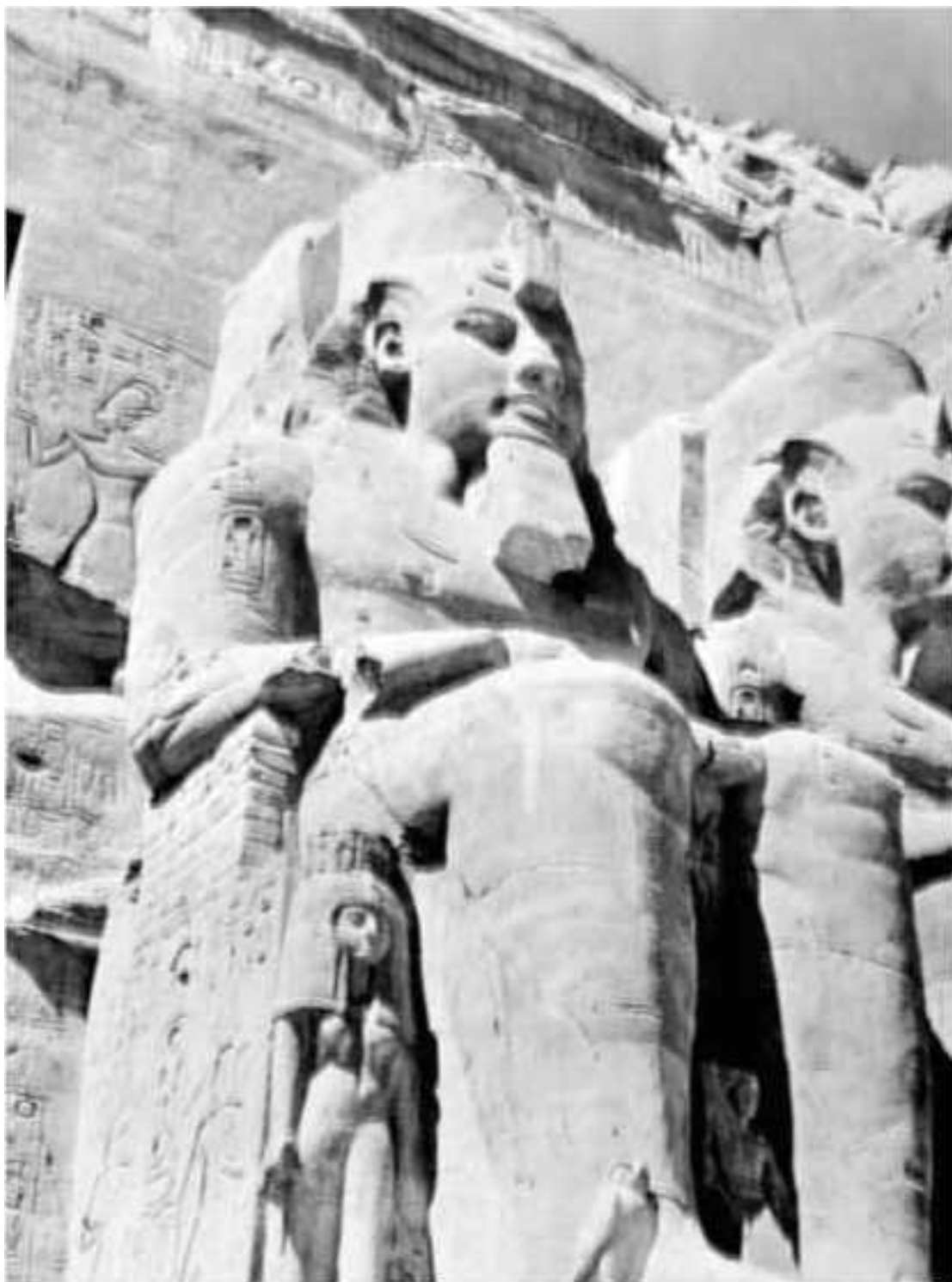
Статуя фараона Рамсеса. Египет

Пока в Египте происходили эти драматические события, потомки Иакова вели однообразную, монотонную жизнь пастухов на восточной окраине Дельты и, вероятнее всего, судя по некоторым намекам в Библии, они утратили ту таинственную веру, которую имел Авраам, веру в то, что ему и его семье принадлежит какая-то особая роль в истории. Они жили, как пастухи, и столетия пролетали над ними, как сон. Для пастуха все протекает однообразно, в соответствии с сезонами, временами года. Письменности не было, память народная сохраняла немного: какие-то сказания, среди которых, вероятно, были и те, которые затем составили начало Библии – о сотворении мира, о начале человеческого рода.