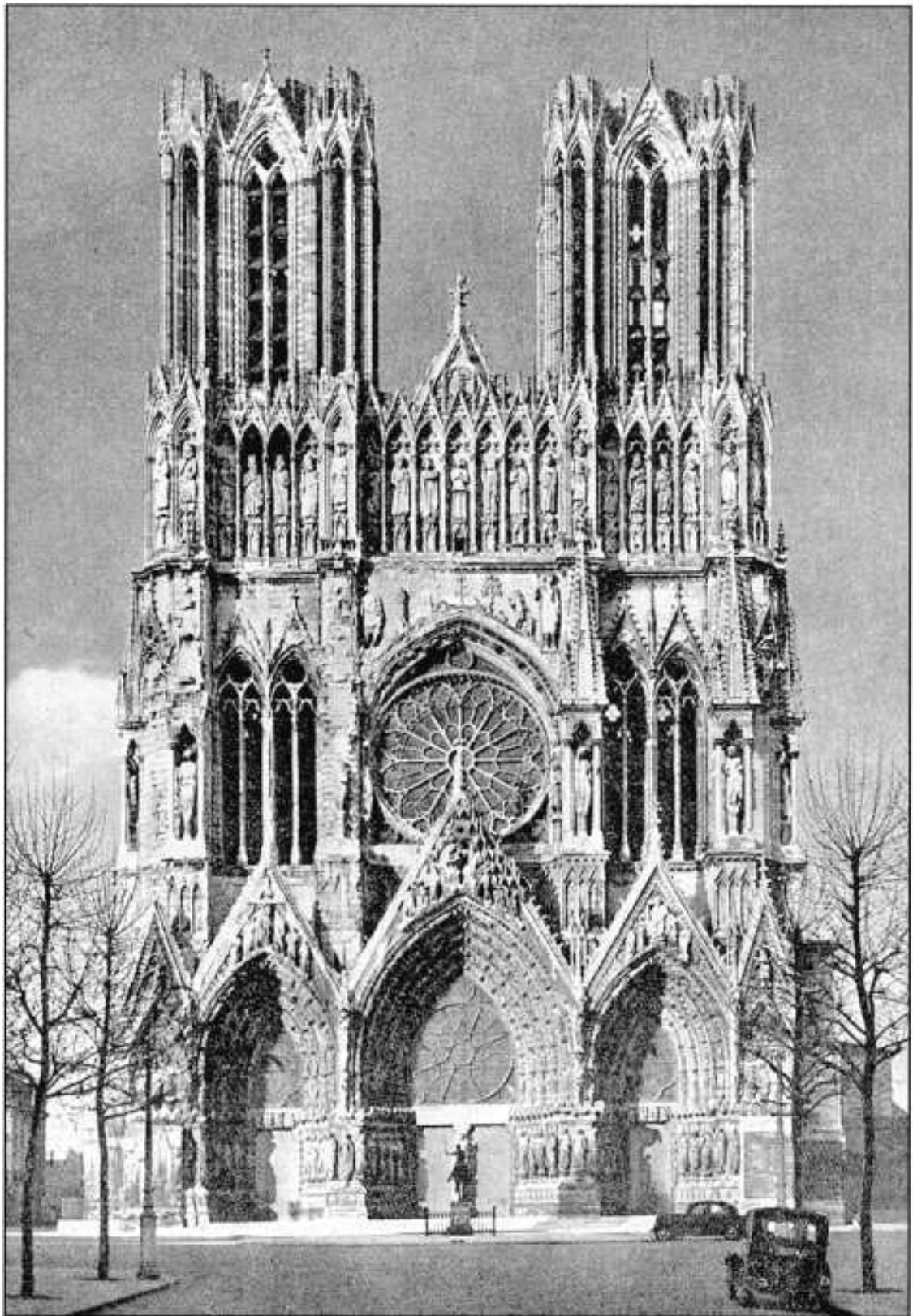
Собор в Реймсе. Западный фасад

Но, положив руку на сердце, так ли это? Евгений Евтушенко, человек во многом благородный, который в трудные годы выступал смело, в одном из стихотворений написал: «Я верю в человека». И там же он разносит всех тиранов, диктаторов, Салазара, Берию. Но ведь они тоже были людьми. В кого же надо верить? Почему мы должны верить в хорошее, а не в плохое?