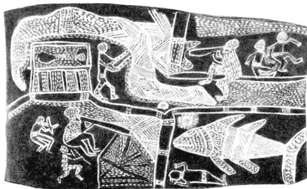
Южноскандинавские наскальные культовые изображения эпохи бронзы

Такова была идеология XVIII и XIX веков. Наверное, многие из вас слышали имена знаменитых в свое время (около 100 лет назад) ученых, таких, как Эдуард Тейлор (он был одним из крупнейших специалистов по мифологии и первобытным религиям) и Джеймс Джордж Фрэзер, книги которого, например, «Золотая ветвь», недавно у нас переизданы. Не общаясь с людьми первобытного уровня, с так называемыми дикарями, получая материалы из третьих рук, они создавали свои конструкции о дикости, темноте, наивности и примитивности человека, стоящего на низком материальном уровне развития цивилизации. Но потом многие из западных ученых вынуждены были отказаться от такого взгляда. Миклухо-Маклай был одним из первых, кто, пусть и ненадолго, вошел в мир этих людей. И что ему открылось? Что это такие же люди, с такими же переживаниями, страстями, грехами, ошибками, с умением думать логически, ясно. Миклухо-Маклай писал: «В их верования, в их душевную жизнь я старался не проникать». Он был человеком очень тактичным; и вообще он считал, что столь малого времени, какое он прожил на гвинейском побережье, недостаточно, чтобы понять душу первобытного человека.