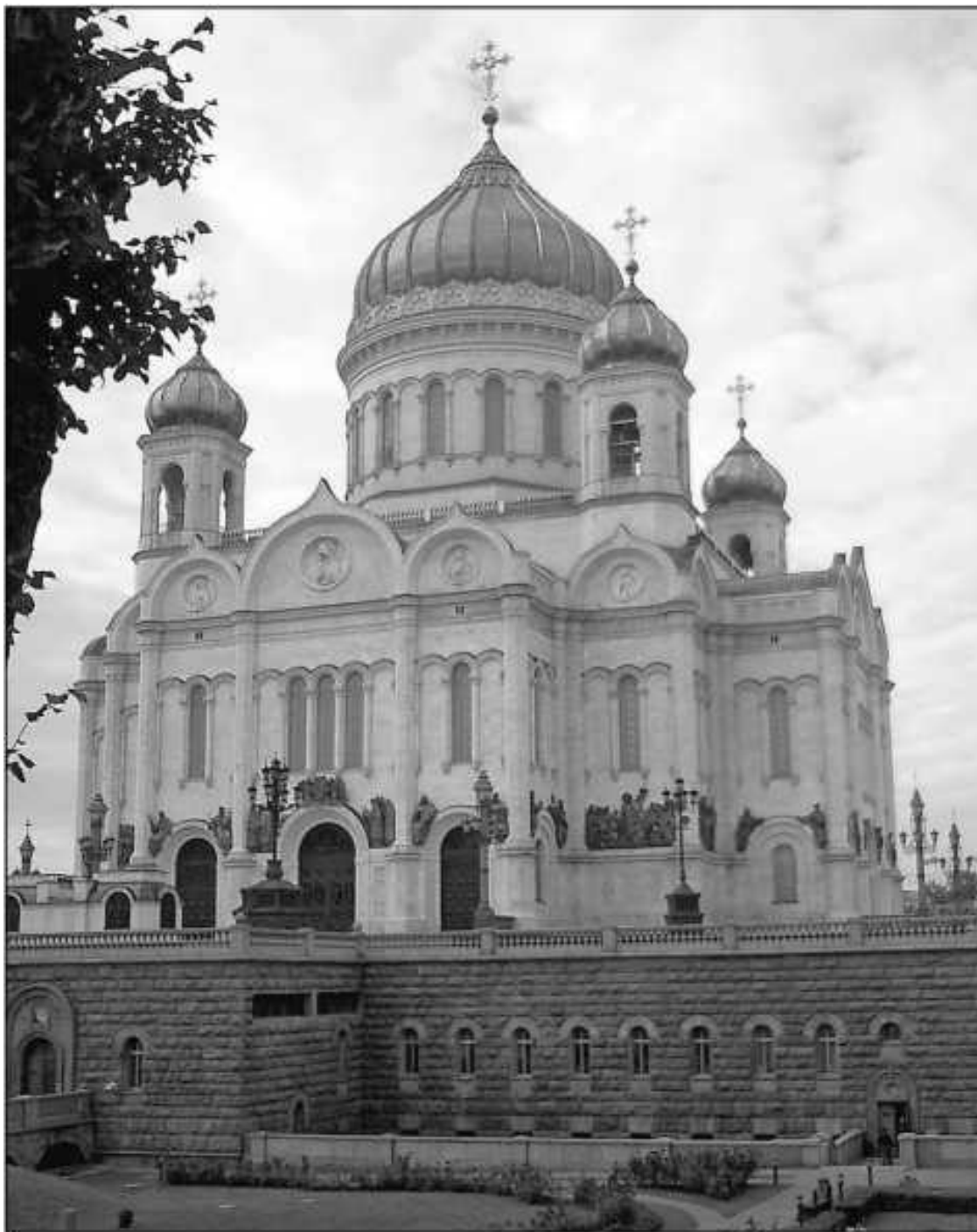
Храм Христа Спасителя

Когда мы говорим о началах любой культуры, мы должны прежде всего задать себе вопрос не о том, какие материальные формы ее куют, а о том, какой дух лежит в ее основе. И пробегая мысленным взором историю цивилизации, мы всегда можем точно определить, какой дух стоит за культурой. Более того, мы знаем, что когда в духовной сфере у человека начинается дестабилизация, разброд, кризис, то дестабилизация охватывает всю культуру. Вот поэтому мы с вами сегодня хотим заглянуть в историю духовности, в прошлое цивилизации нашей страны и всего мира не из праздного любопытства («а как это было раньше?»), а для того чтобы понять глубинную и нерасторжимую связь культуры и веры, ту связь, которая была забыта, отброшена, которая сознательно отрицалась. Жизнь, практика подтвердили старую истину: когда подрываются корни, засыхает и дерево, и для оживления корней необходимо