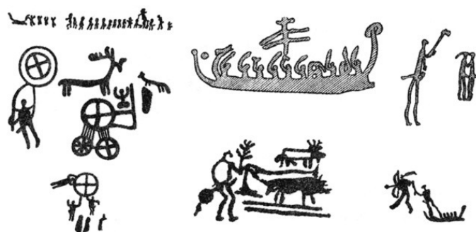
Южноскандинавские наскальные культовые изображения эпохи бронзы

Ученые спорят о том, в какой степени можно относить неандертальца к человеческим существам, но едва ли кто-нибудь из них может доказать свою точку зрения и обосновать ее, потому что мы не можем проникнуть в сознание этого человека, или человеческого существа, или недочеловеческого существа. Все-таки это, скорее всего, другой вид, несомненно низший. В его культуре мы уже находим примитивные каменные орудия, огонь, который поддерживался довольно долго, но не находим искусства, которое является важнейшим спутником всей человеческой истории. А искусство древних людей всегда было связано с духовным, религиозным началом.