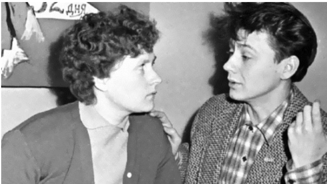
Актеры театра «Современник» Людмила Иванова и Олег Табаков. 1958 год