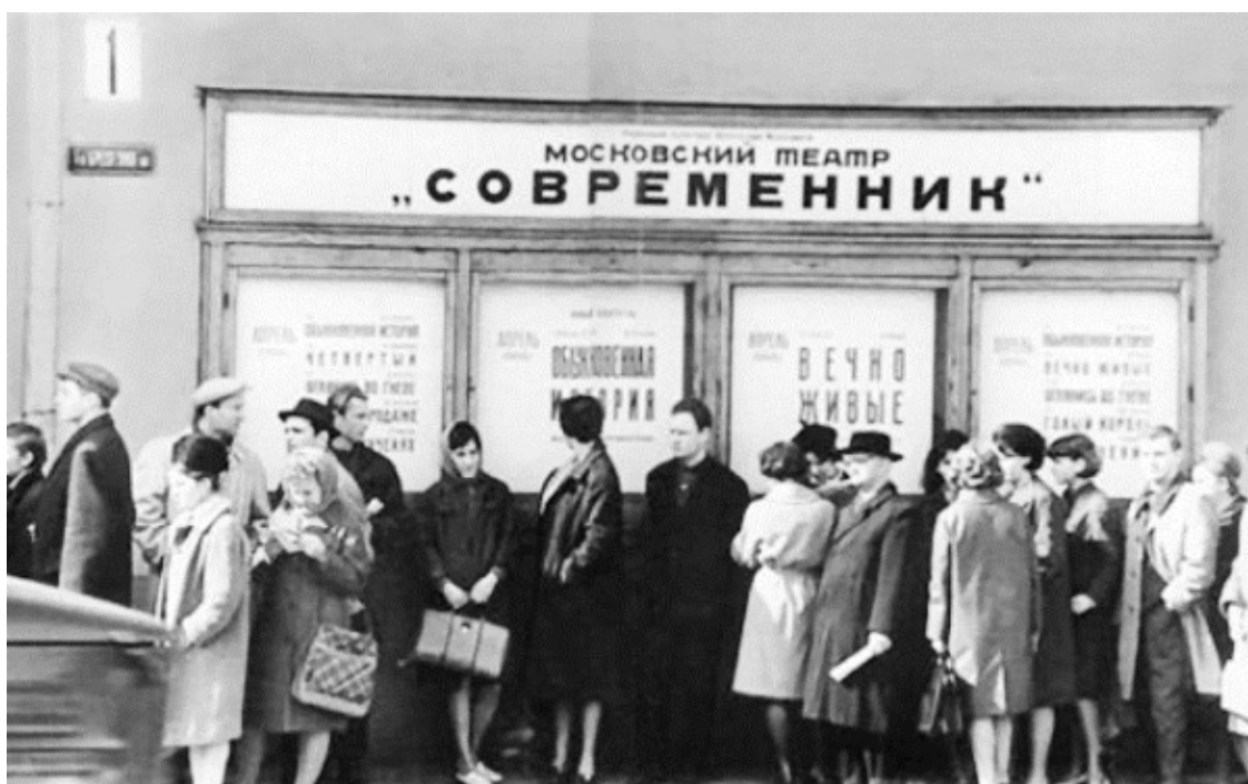
У старого здания театра «Современник» на площади Маяковского. Начало 1960-х годов. В репертуаре – спектакль «Вечно живые» по пьесе В. Розова

После эвакуации Бороздины возвращаются в Москву, с ними Анна Михайловна и Володя. Марку дают понять, что его присутствие в доме нежелательно. Володя влюблён в Веронику, но она просит его не требовать от неё ответа: она всё ещё помнит Бориса и любит его. За окнами начинается салют в честь перехода советских войск через германскую границу.