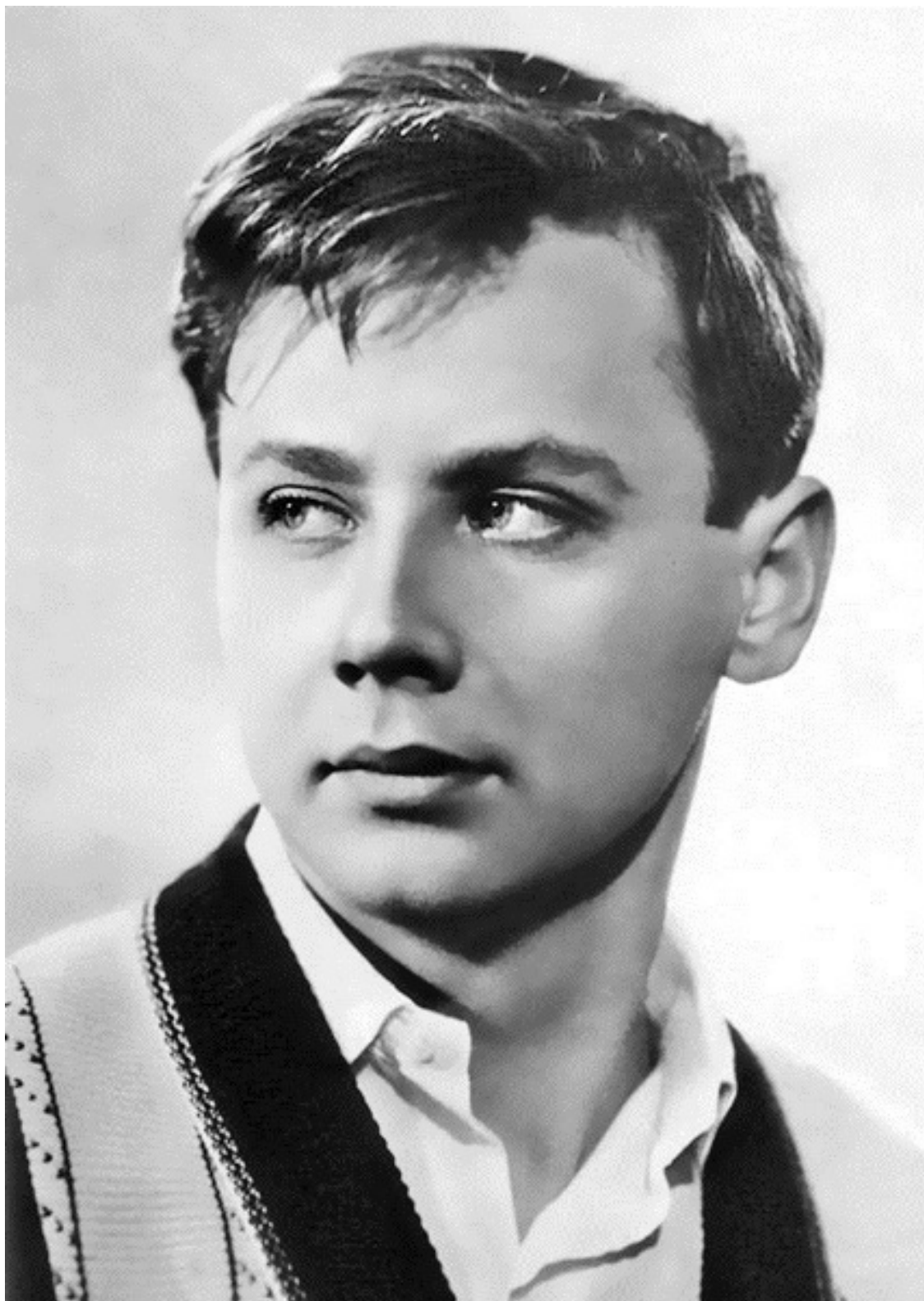
Олег Табаков в молодости