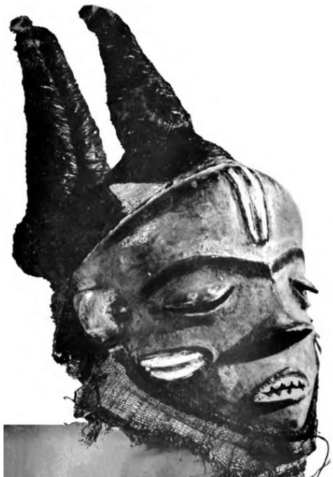
Ритуальная маска шамана. Африка

Субъективная эмоциональная сторона шаманизма нередко характеризуется ощущением великой космической радости причастия к мировой Душе, которое мы позднее находим в греческом дионисизме. Объективно за религиозным опытом шамана стоят, скорее всего, скрытые носители одухотворенности мироздания из сферы трансфизического бытия 98 .