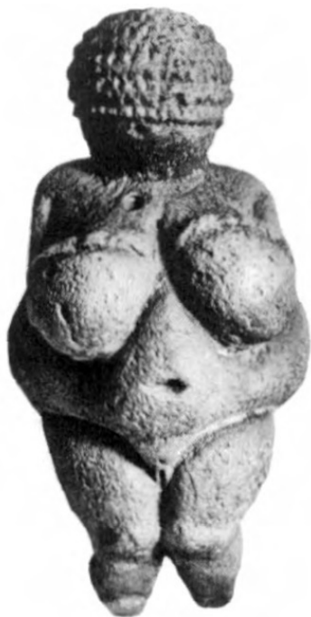
Статуэтка, изображающая женское божество. Каменный век. Виллендорф, Австрия

тельность рождения и вскармливания без малейшего намека на мышление. Это – древнейшее воплощение идеи “вечной женственности”» 34 .