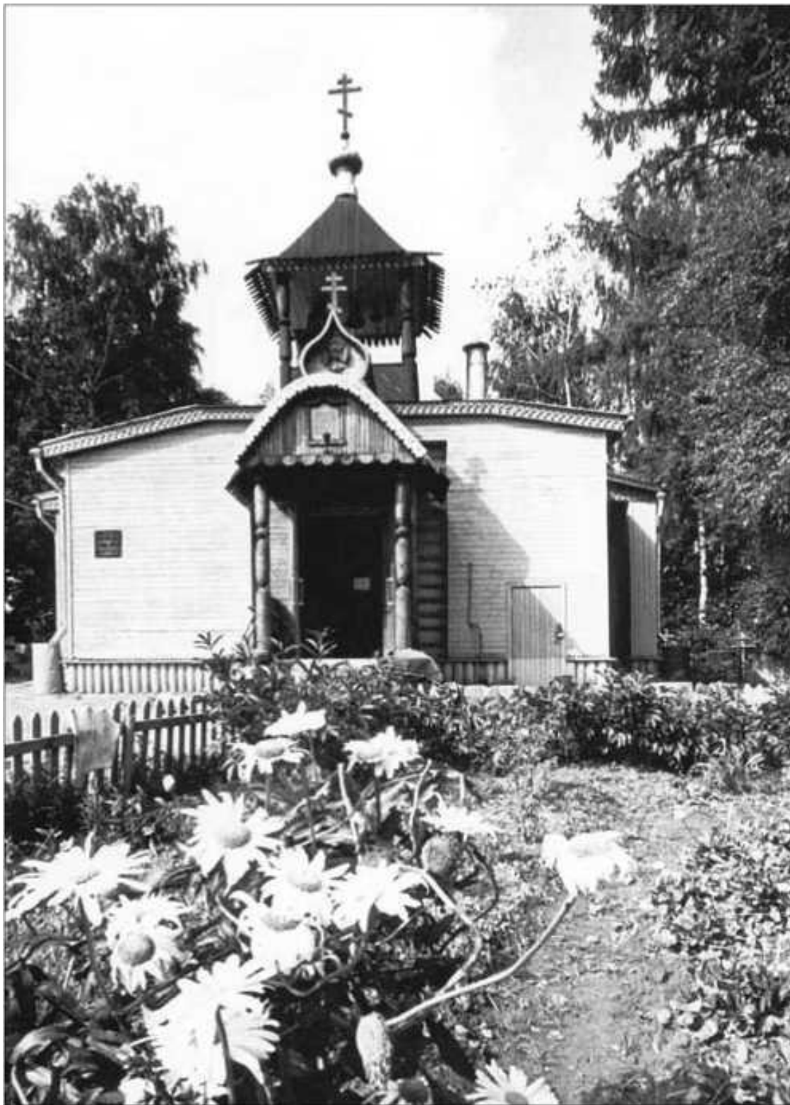
Сретенский храм в Новой Деревне