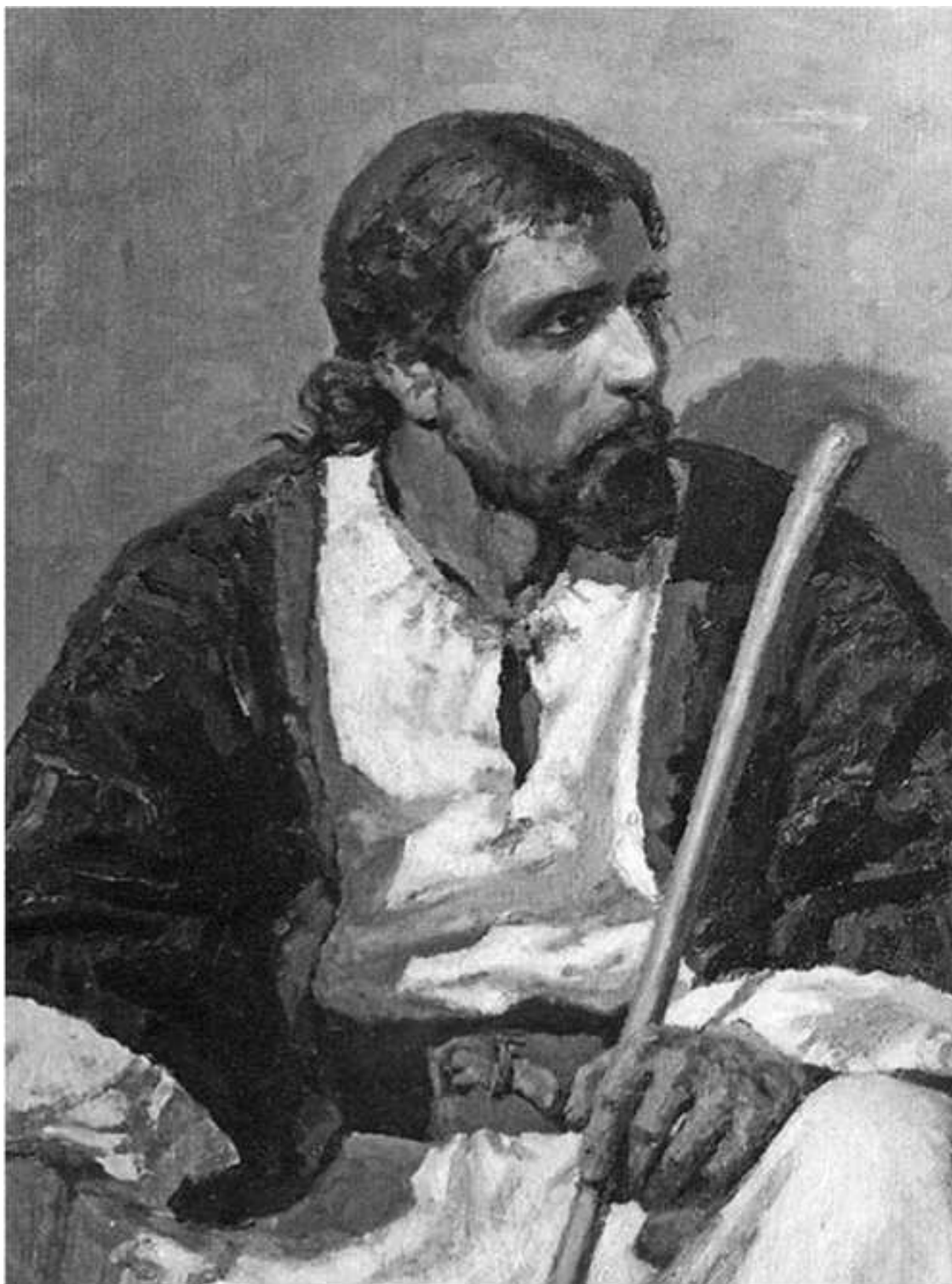
В. Д. Polenov. Христос и грешница. Фрагмент

И нужно было Откровение Божие, то есть действие Духа, Который бы открыл людям то, что они путем разума познать не могут, что мир есть не вращение по кругу, а мир есть становление . Мир есть путь. История мира есть движение к чему-то высшему. И, как я вам уже говорил, все секулярные, светские надежды на лучшее будущее являются сегодня отражением, сколком или трансформацией этого библейского Откровения.