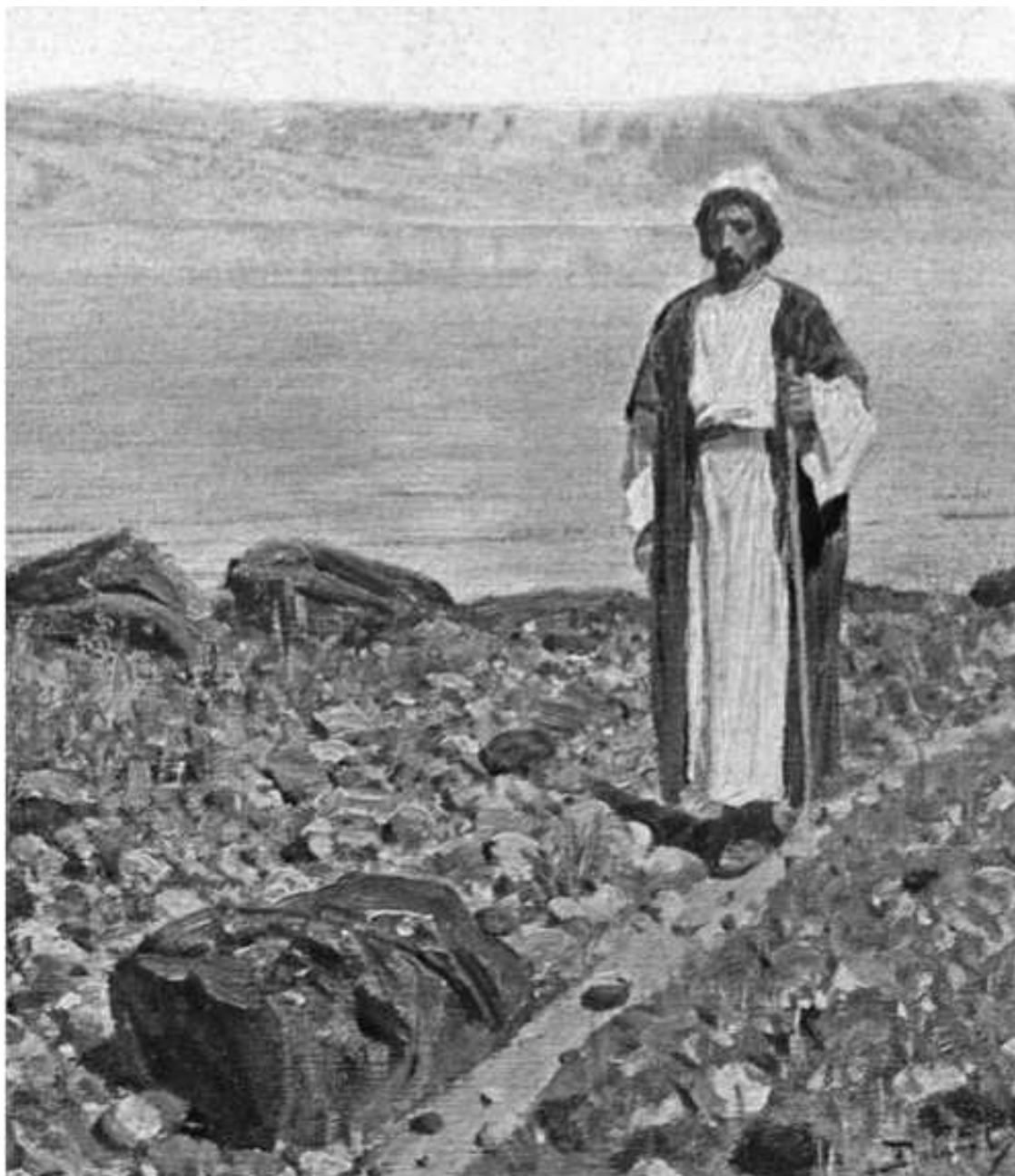
В. Д. Поленов. У моря Галилейского. Фрагмент

И сам Христос говорит о Себе, что Он пришел исполнить не Свою волю, но волю Отца. Для Него не было в жизни ничего другого – все Его служение было подчинено высшему призыванию. Такой человек может представляться нам в виде какого-то анахорета, отшельника, или какого-то йога, сидящего где-нибудь в Гималаях, который съедает лишь горсточку риса в неделю. Ведь они действительно отрешились от всего и созерцают Вечность.