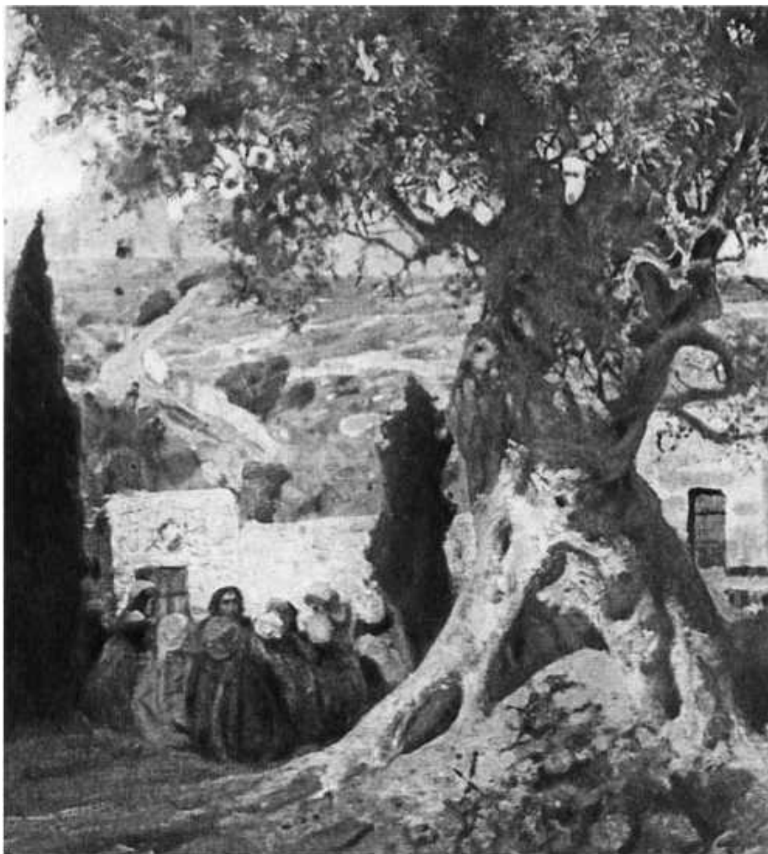
В. Д. Поленов. Часто собирались в Гефсимании

Не лишенные юмора, даже некоторого остроумия, иногда иронии, они рисуют человеческую жизнь и людей, которые пытаются войти в Царство Божие или убегают от него. Он любил изображать это в виде притч – бытовых, жанровых сценок, которые, конечно, произносились с улыбкой или вызывали улыбку у слушателей. Для нас, людей XX века, эти притчи уже воспринимаются с дистанции времени как торжественные речения, через иконы, картины, – для нас все это уже как бы сакрализовано, возвеличено, возвышено.