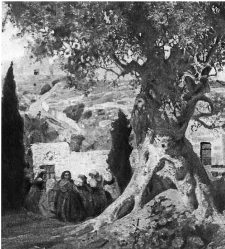
В. Д. Polenov. Часто собирались в Гефсимании

Не лишенные юмора, даже некоторого остроумия, иногда иронии, они рисуют человеческую жизнь и людей, которые пытаются войти в Царство Божие или убегают от него. Он