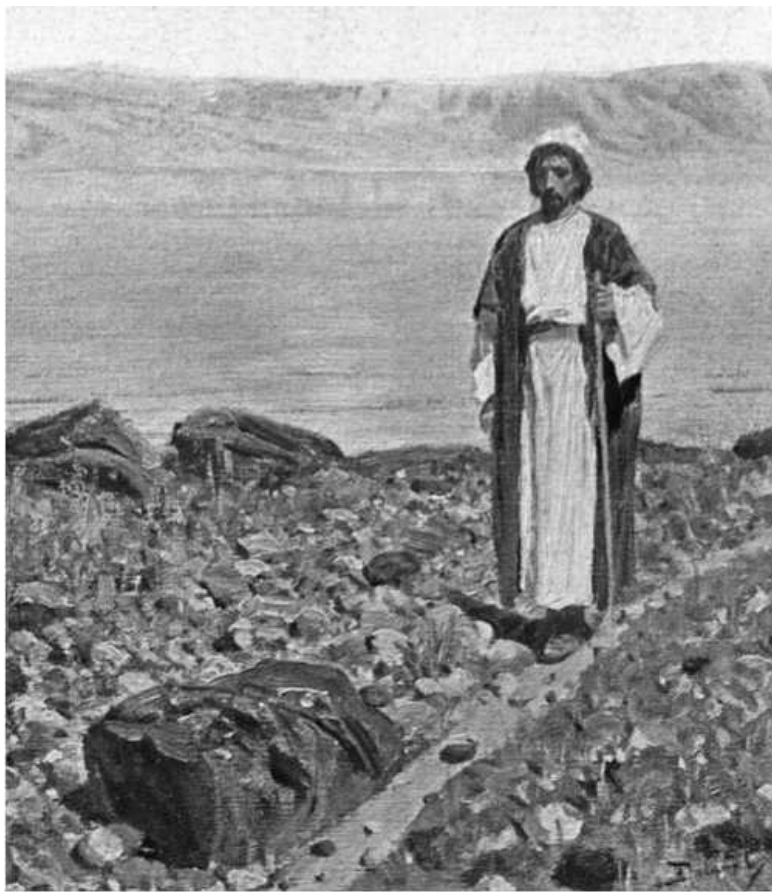
В. Д. Polenov. У моря Галилейского. Фрагмент

И сам Христос говорит о Себе, что Он пришел исполнить не Свою волю, но волю Отца. Для Него не было в жизни ни-