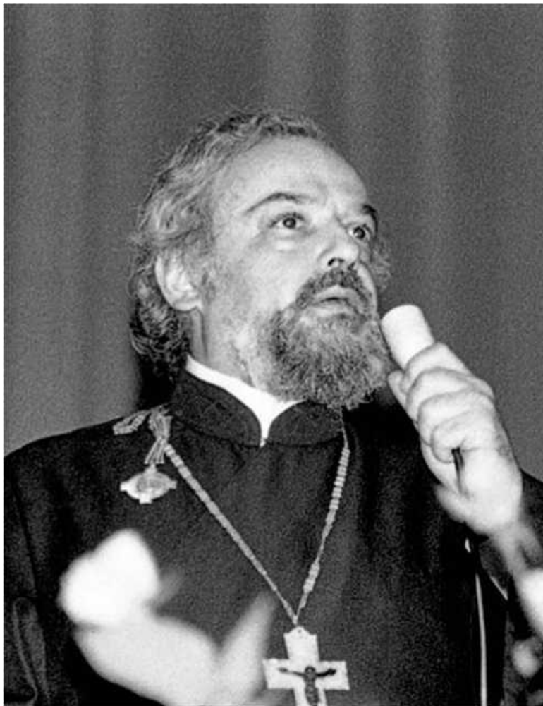
Протоиерей Александр Мень. 1987