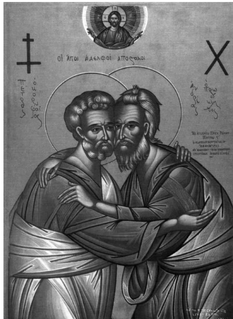
Апостолы Петр и Андрей

О личности Иакова сведений почти нет; известно только, что он первый из Двенадцати отдаст жизнь за исповедование Христа. Его младший брат – фигура более заметная. Иоанн – любимый ученик Иисуса, что само по себе говорит о многом. Прочно установившееся, и скорее всего достоверное, предание относит его смерть к самому концу I века. Следовательно, среди Двенадцати он самый младший, в момент призвания ему исполнилось не более двадцати лет 21 . Если бы существовала уверенность, что все писания, носящие имя Иоанна, вышли непосредственно из-под его пера, это пролило бы дополнительный свет на его личность. Но поскольку такой уверенности нет, мы пока ограничимся тем, что известно из Евангелий.