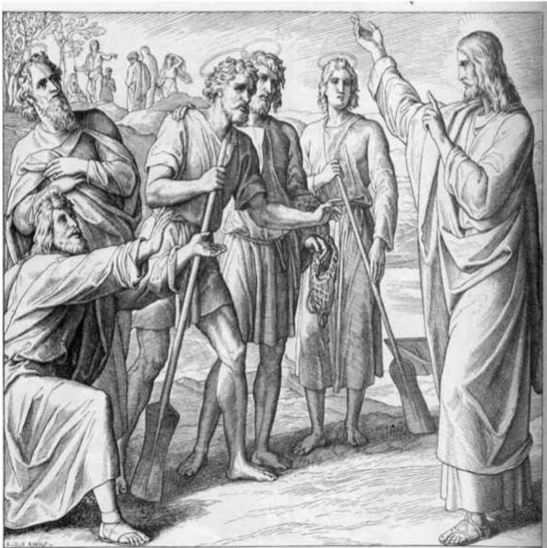
Юлиус Шнор. Первые ученики Иисуса Христа