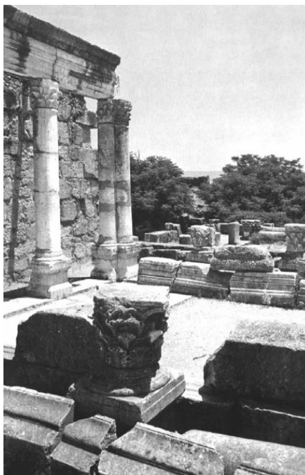
Капернаум. Развалины синагоги