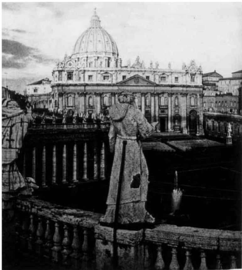
Рим. Собор Св. Петра

Используя эту «икону» св. Петра, противники христианства пытались доказать, будто сам его образ возник из перекроенных языческих мифов. Кто только не помянут среди