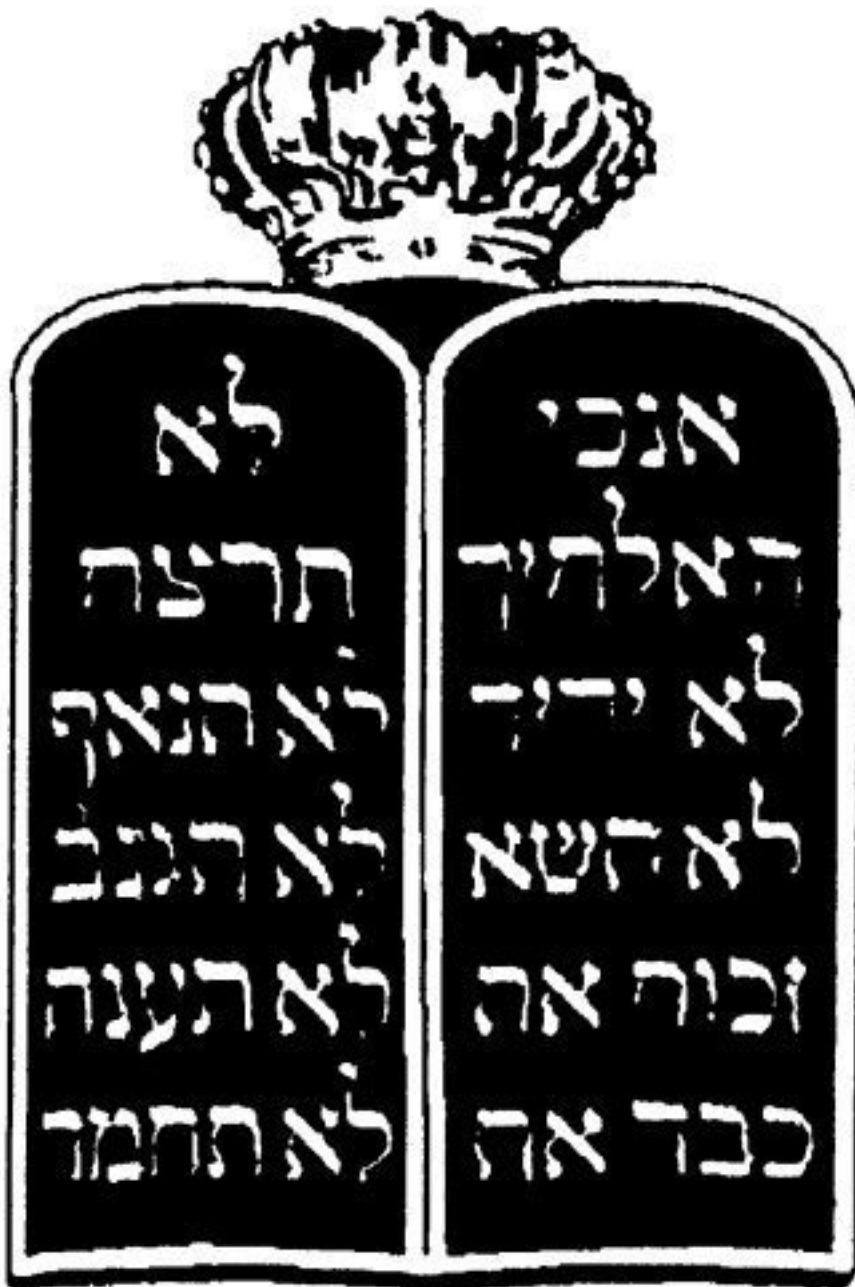
Илл. 6. Скрижали с десятью заповедями Яхве