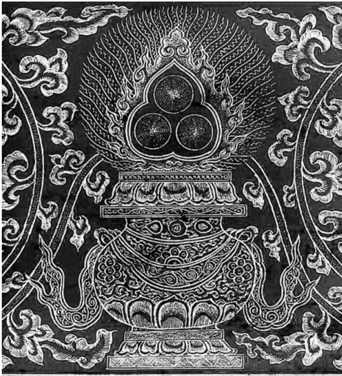
Илл. 5. Триратна Джинны

ной неканонической «Книге Товита», где Товит, дядя Ахикара, внушает своему сыну Товию: «...будь благоразумен во всем поведении твоём. Что ненавистно тебе самому, того не делай никому» (Тов. 4:15).