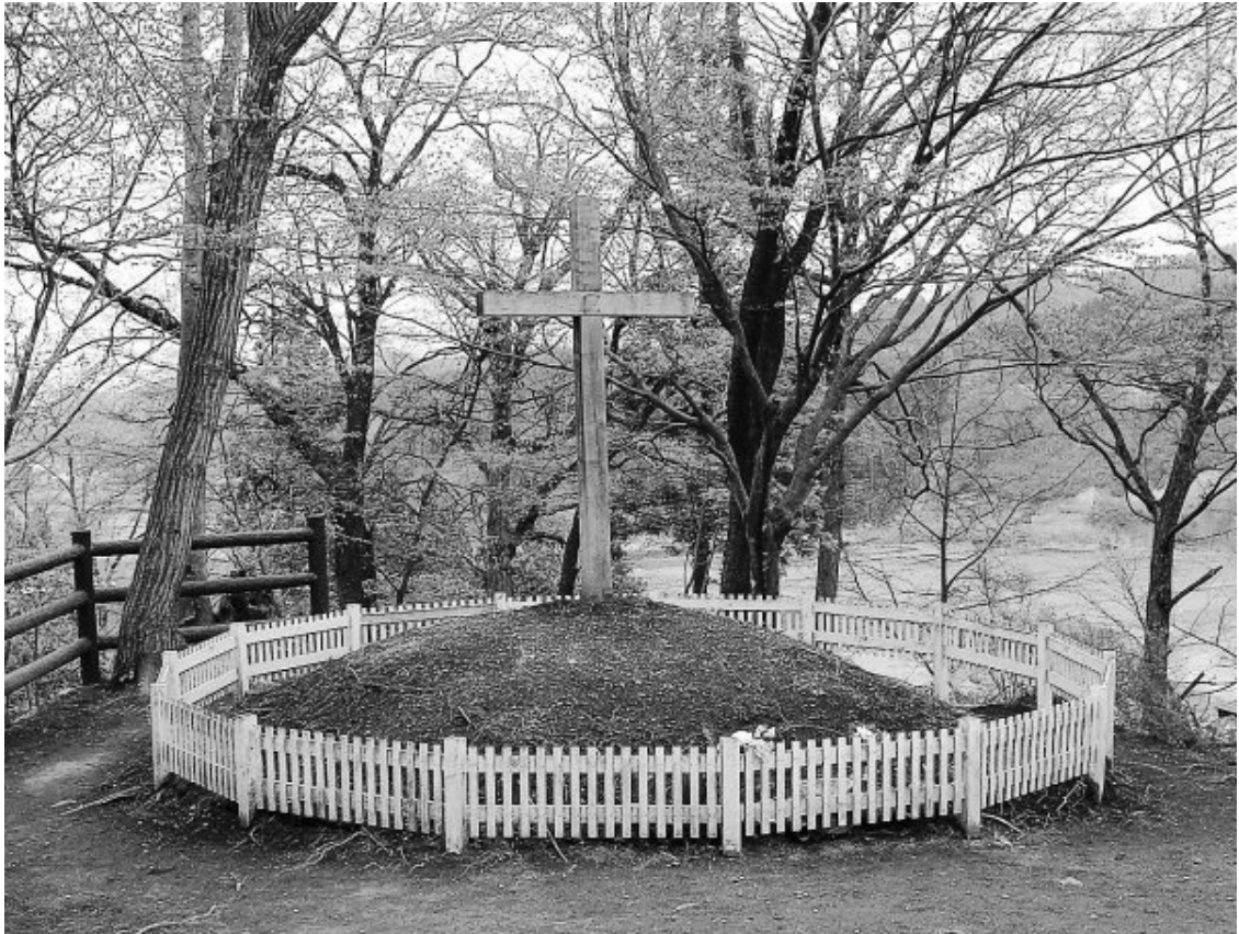
Илл. 9. «Могила Иисуса» в Шинго, Япония