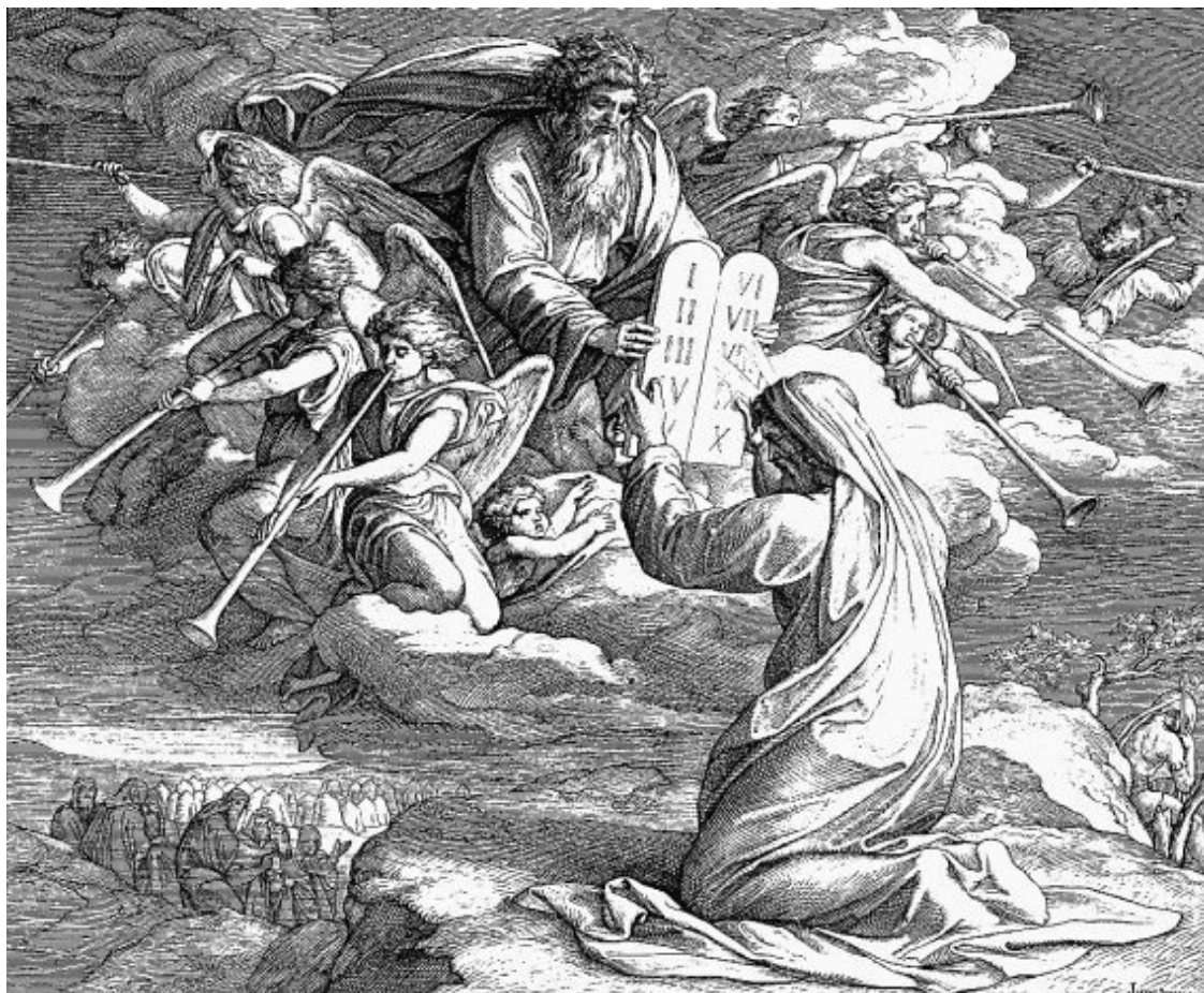
Илл. 10. Моисей получает скрижали на вершине горы Синай

«Помимо непосредственной генетической связи, история культуры отметила ряд фактов соответствий между некоторыми явлениями в развитии античной философии и аналогичных явлений в развитии философии весьма отдаленных от Греции, Древнего Китая и Древней Индии», – отмечал В. Ф. Асмус в предисловии к книге «История античной философии». «Является ли преемственность культур или связи между ними единственным объяснением, единственной причиной сходства философских систем и открытий (откровений. – Авт.)? Такое сходство, наблюдаемое у отдаленных культур (Греция – Индия, Китай – Америка) – свидетельство противоположного . Даже и без непосредственного контакта люди в разных углах Земли пришли бы к одним выводам и открытиям, ибо причина, приводящая к ним, – одна и та же . Вот правило; контакты же – исключение, хотя (в европейском ареале особенно) на них следует делать серьезную поправку» 26 .