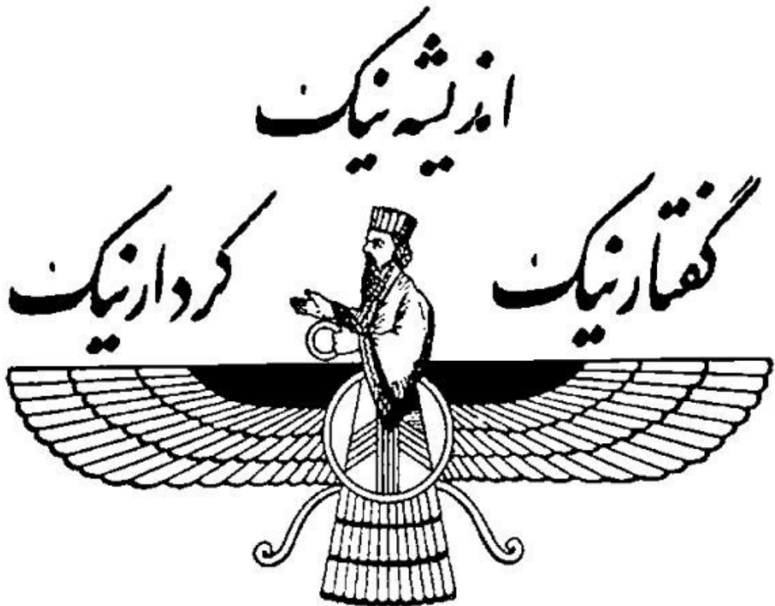
Илл. 7. Три принципа благой жизни зороастризма

Тот факт, что в разных культурах, связь между которыми на том этапе маловероятна и во всяком случае никак не удостоверена не ведавшими друг о друге мыслителями, один и тот же принцип формулируется схожим, практически одинаковым образом, не может не вызывать удивления!