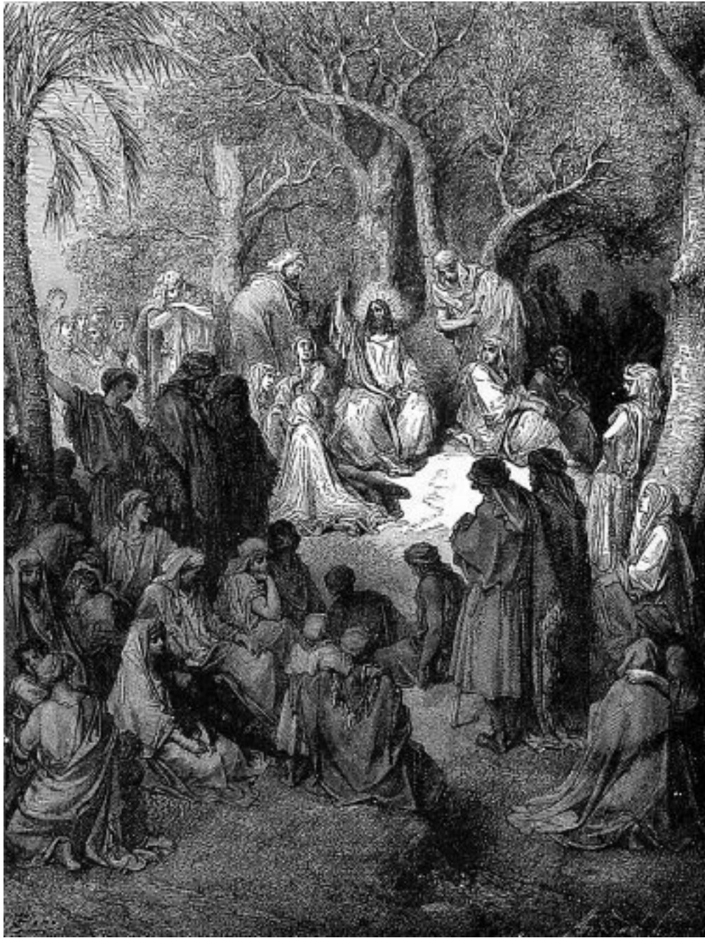
Илл. 4. Нагорная проповедь Иисуса

И еще дальше на Востоке, уже на самом краю Ойкумены, в трактатах мудрецов Древнего Китая мы обнаружим те же слова. «Мудрый человек действует без насилия и никому ничем не вредит», 8 – записал Лао-цзы (предположит. 604–517 гг. до н. э.) в «Книге о Дао и дэ». А в трактате Конфуция (551–479 гг. до н. э.) встречается уже совершенно идентичная формулировка: «Цзы Гун спросил: как в немногих словах выразить принцип, которым можно руководствоваться всю жизнь? Учитель ответил: „Не делай другим того, чего не пожелаешь себе“» 9 .