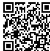
Рисунок №2: История о гардеробщице

Сами решайте, правда это или вымысел. Мое мнение, что здесь на лицо, как минимум, полуправда. Возможно, часть ситуации имела место быть. Помните сказку Александра Сергеевича о царе Салтане, когда три девицы под окном пряли поздно вечерком и между делом фантазировали о том, чтобы они сделали, будучи царицей. Подобная история могла приключиться и с гардеробщицей. Кто-то подслушал ее креативные рассуждения и додумал дальше сам. И грех было бы не сделать этого. Иначе мы лишились бы замечательной истории!