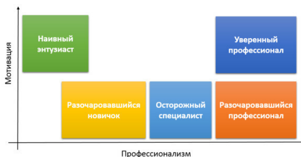
Рисунок №4: Типы писателей-любителей по уровню мотивации и профессионализма

Правда не всем удастся долго удерживаться на гребне волны успеха. Что-то всегда может пойти не так в этом непредсказуемом мире. Он меняется с пугающей скоростью. Тема, в которой вы стали признанным экспертом, вышла из моды и больше не пользуется спросом. На арене появился более молодой и проворный конкурент, который оказался интереснее публике. Бог знает, что еще может произойти. В результате часть «уверенных профессионалов» покидает их уверенность, и они возвращаются на стадию, похожую по симптомам на состояние «осторожный специалист». Назовем ее «разочаровавшийся профессионал» (рисунок №4).