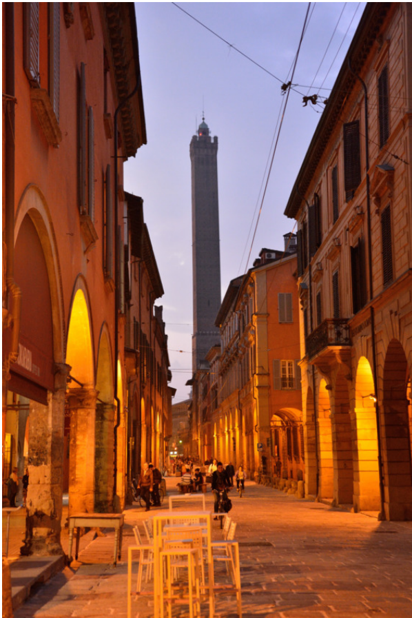
Рис. 3. Вид на башню Asinelli.

Меньшая из двух башен – Гаризенда, изначально было высотой около 60 метров, но из-за сильного наклона была уко-