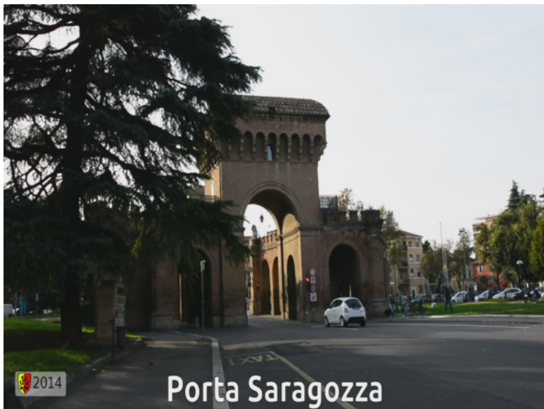
Рис. 6. Этими воротами заканчивалась улица Сарагоцца, на которой когда-то преподавал ди Лука. Кадр из фильма «Улицы болонских мастеров» [36].