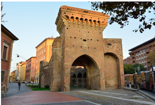
Рис. 4. Болонские ворота.

Изначально башня Азинелли была выше на 20—25 метров, но она была укорочена в конце 15 века. В 1488 году у основания башни была построена небольшая крепость, служившая караульной для солдат. Башня Азинелли является самой высокой падающей башней. Отклонение от вертикали составляет 2.23 метра. За свою историю башня использовалась как крепость, как тюрьма, во время WWII как наблюдательный пункт, после войны – как телевышка. В наши дни это туристическая достопримечательность, и за небольшую плату можно подняться до самого верха.