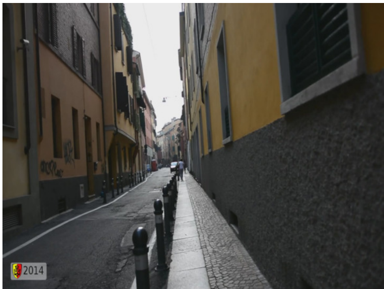
Рис. 5. Улица Петралата. Наши дни. Кадр из фильма

Улица Петралата существует и сейчас. Пока не удалось выяснить, где именно на этой улице располагался фехтовальный зал Филипо Бартоломео Дарди.