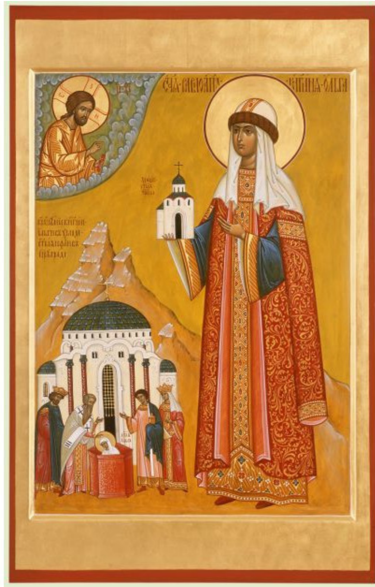
Икона с княгиней Ольгой современного письма. [7]

В наследство княгиня Ольга оставила своему внуку князю Владимиру уважение Византии, крепкую экономику Руси и сильную дружину. Поэтому не удивительно, что женой князя Владимира стала византийская принцесса Анна, а в качестве приданного он получил Херсонес – крупнейший город Тавриды – Крымского полуострова, который тогда был частью Византии.