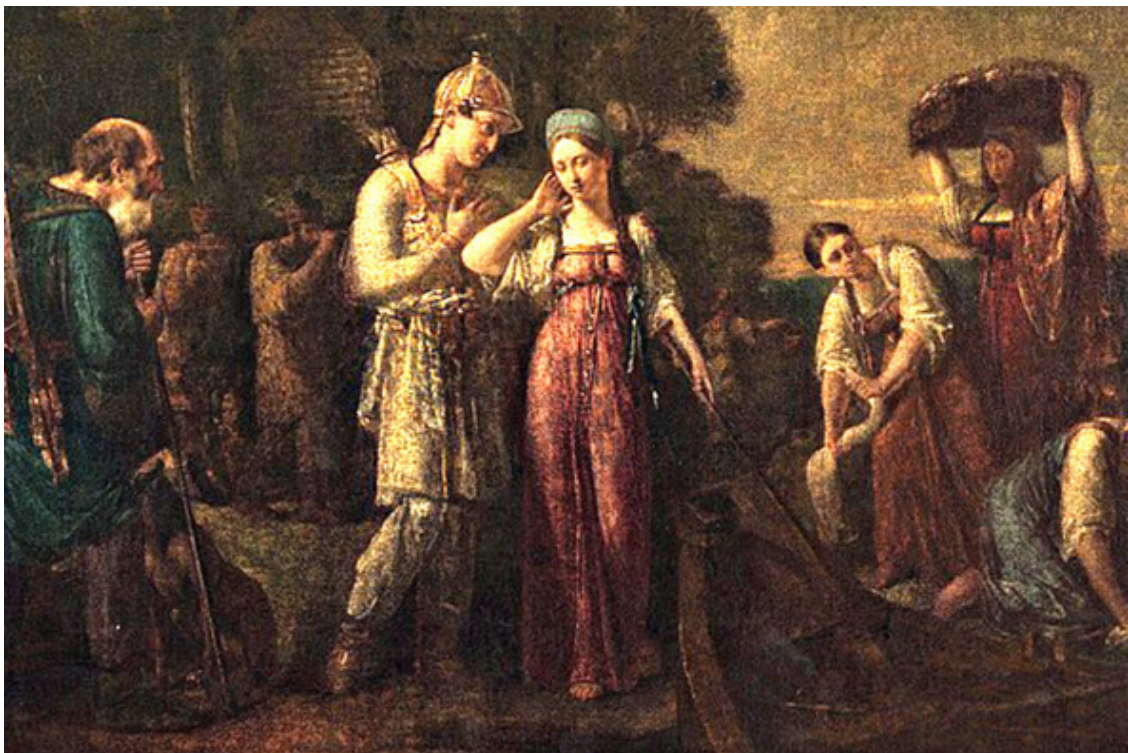
Первая встреча князя Игоря с Ольгой. Василий Сазонов. 1789—1870).

При первой встрече Ольга отвергла легкомысленные ухаживания молодого человека – будущего князя Игоря, но позднее согласилась стать его законной женой и переехала в Киев.