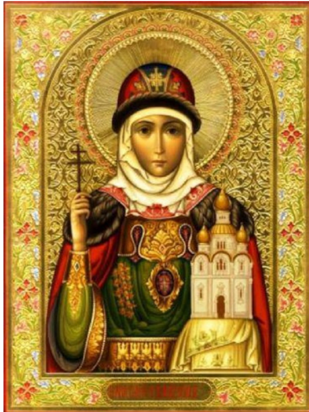
Княгиня Ольга [1]

Для нас интересно, что в ней Рюрик изображается продолжателем династии славянских князей по женской линии. Именно это обеспечивало легитимность его власти. Основателем династии русских и киевских князей выглядит не Рюрик, а Умила из чрева которой выросло гигантское дерево. Это можно истолковать как признак, что первоначально в далекой древности преемственность в русской государственности определялась не по мужской, а по женской линии. В наши дни такое правило действует в еврейском обществе, и в недавние времена существовало в традиции некоторых народов Кавказа.