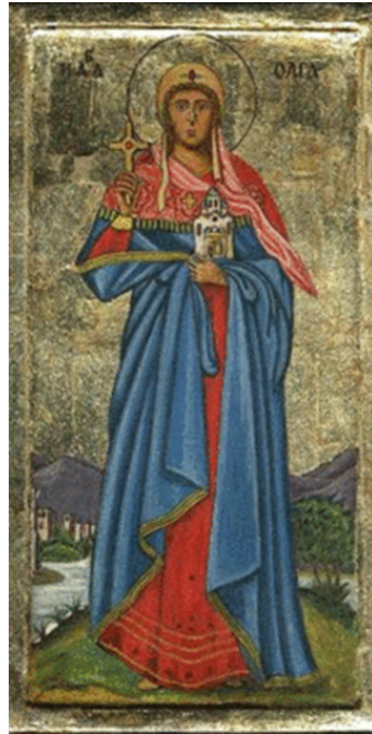
Княгиня Ольга на псковской иконе

При первой встрече Ольга отвергла легкомысленные ухаживания молодого человека – будущего князя Игоря, но позднее согласилась стать его законной женой и переехала в Киев.