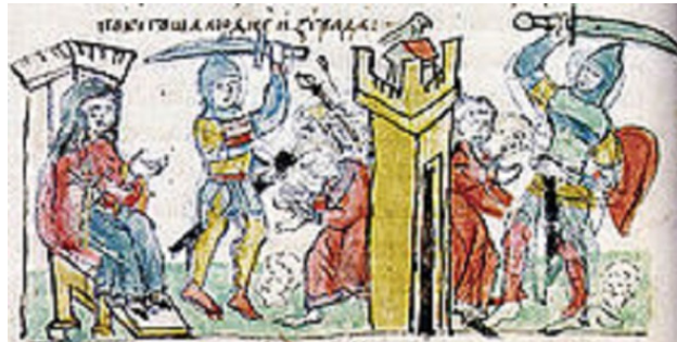
Четвёртая месть Ольги древлянам. Миниатюра из Радзивилловской летописи, 15 век.

Данные летописей о княгине Ольге были впервые введены в научный оборот знаменитым историком Н. М. Карамзиным. Он первым попытался сделать реконструкцию ее биографии и оценить значение деятельности княгини Ольги для древнерусского государства. Следующие поколения историков занимались уточнением и дополнением деталей и выяснением некоторых спорных вопросов [14].