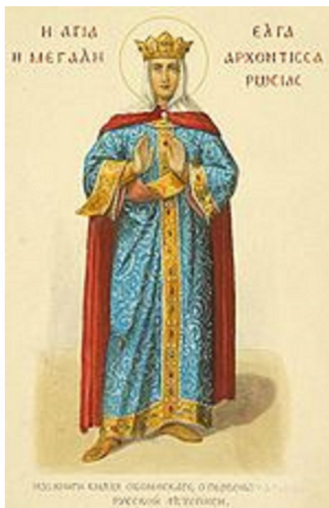
Архонтисса Ольга. Рисунок из старой книги.

Княгиня Ольга прославилась многочисленными государственными деяниями разнородными по масштабу, политическим и культурным результатам и нравственным свойствам. Их невозможно оценить единообразно, но все они отличаются удивительной изобретательностью автора.