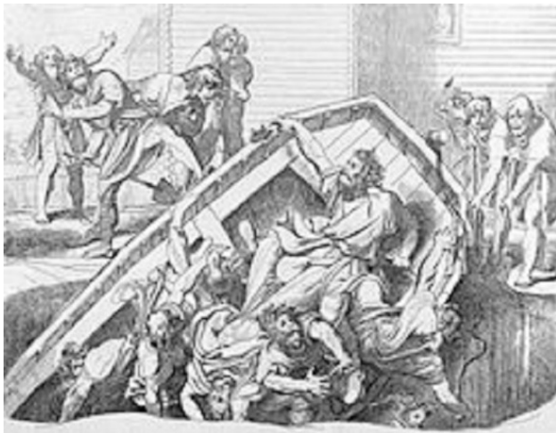
«Мщение Ольги против идолов древлянских». Гравюра Ф. А. Бруни, 1839.