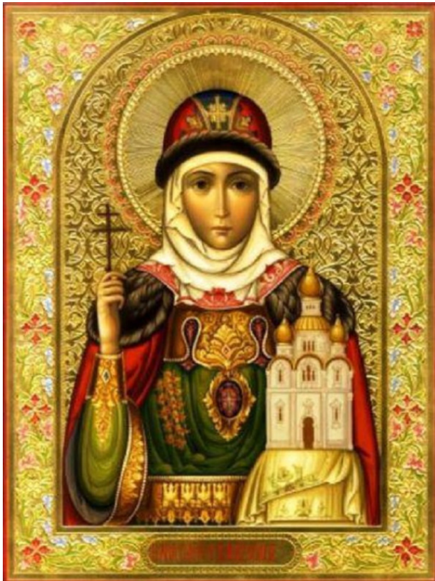
Княгиня Ольга [1]

Для нас интересно, что в ней Рюрик изображается продолжателем династии славянских князей по женской линии. Именно это обеспечивало легитимность его власти. Основа-