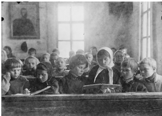
Класс церковно-приходской школы совместного обучения.