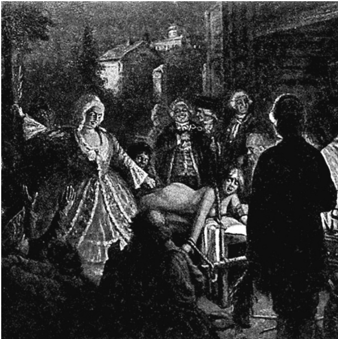
Салтычиха. Фрагмент. Художник Пчелин В.Н.

При жизни мужа за Салтычихой не замечалось особенной склонности к рукоприкладству: это была цветущая и весьма набожная женщина. Примерно через полгода после смерти супруга она начала регулярно избивать прислугу