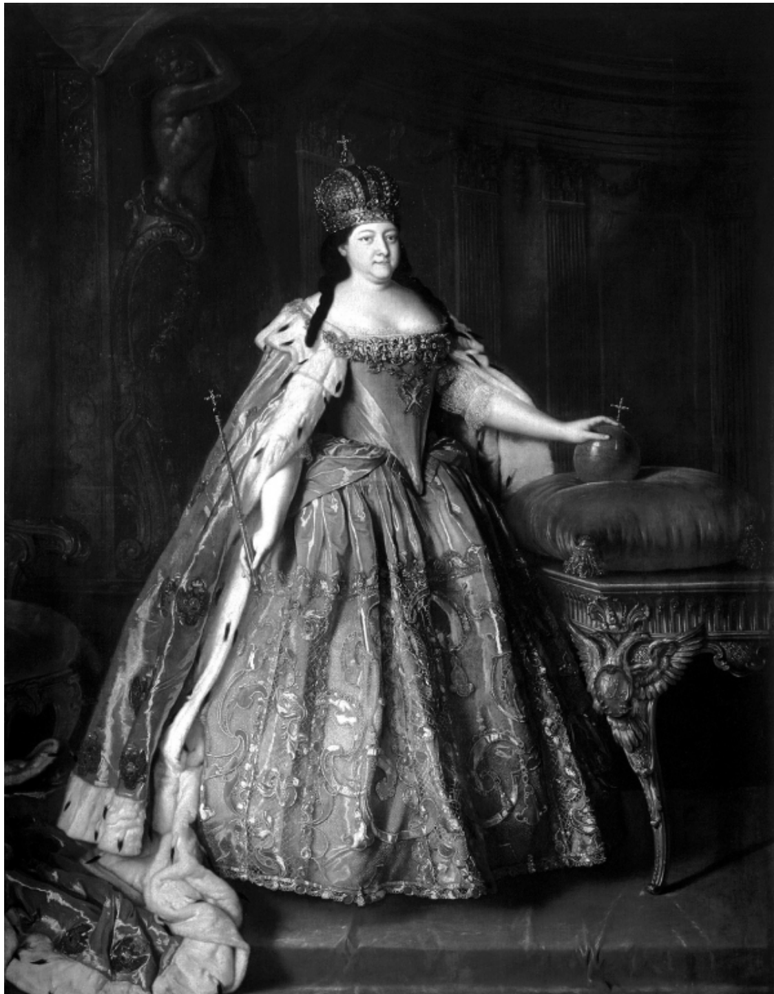
Портрет императрицы Анны Иоанновны. Художник Каравак Л. 1730 г.