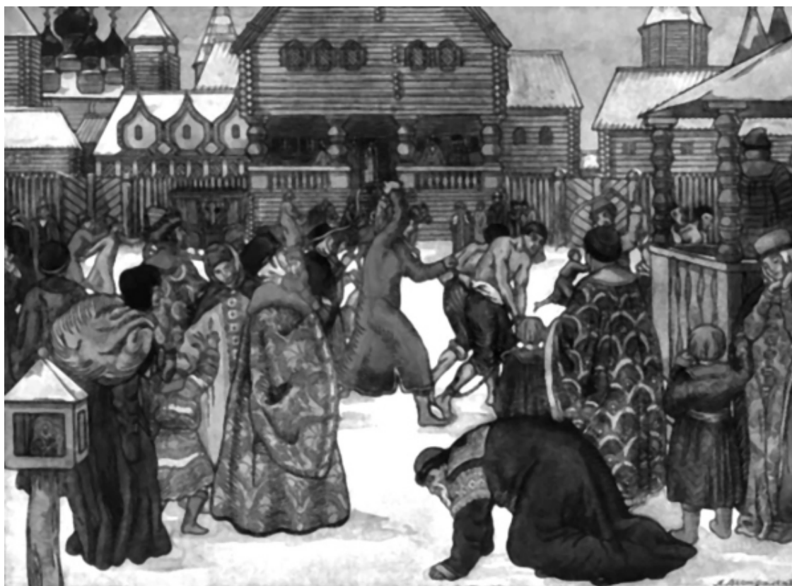
Торговая казнь. Художник Вестфален А.И.

Домой он возвратился в каком-то жгучем угаре. Всю ночь потом ему не спалось, и наконец, уткнувшись лицом в подушку, он тихо заплакал, а когда заснул, то метался, как больной. Странные и непостижимые сны снились одинокому, всеми презираемому и никому не нужному уроду, и среди всех этих снов он почему-то сознавал, даже хотел себя уверить в том, что уродливое тело имеет и уродливые помыслы.