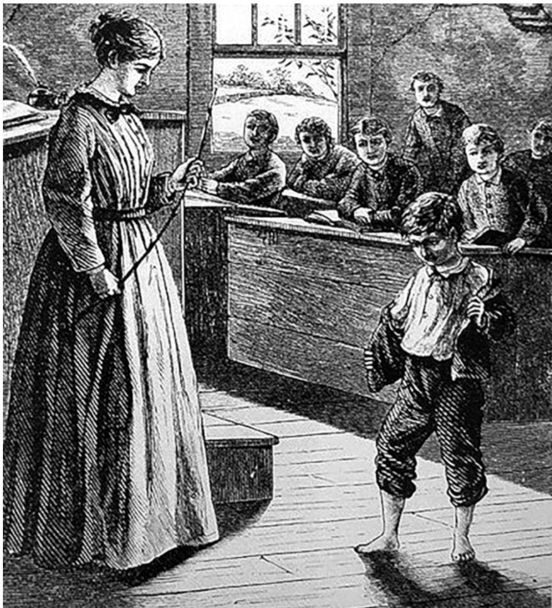
Наказание в школе. Гравюра.

Телесные наказания детей применялись с глубокой древности их родителями, воспитателями, учителями. Ребенок рассматривался почти как собственность родителей, которые могли его наказывать практически любым способом и передавать это право другим