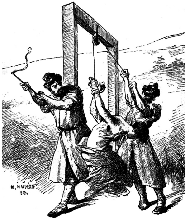
Дыба и кнут. Литография «Орудия пытки». Фрагмент.