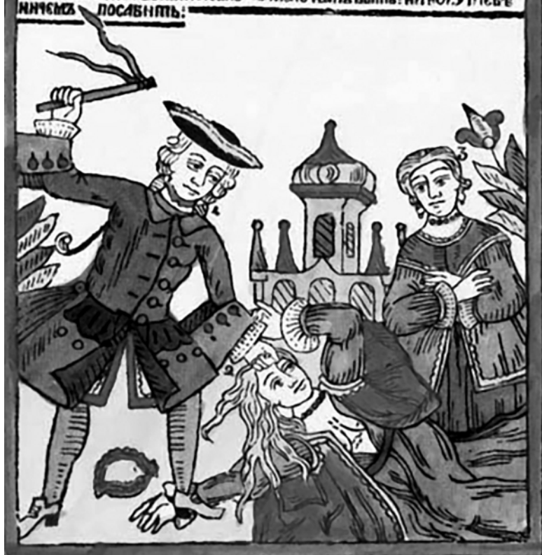
Муж жену бьет. Из собраний русских народных картинок

1: НЕУДОМАН ТЫЕВЪ СЪМНЯ РЪКЮТЬ НЧУЖИХЪ ЛЮБОВНИКОВЪ ВОЗЛЮБИТЬ: ВОТЪ ТЫЕВЪ СПАМУ СПИМУ РУВНТЬ ПОЗАБУАСЪ КНИМЪ ВГОСТИ ЗСОДТЬ: ЛЮБИТЬМЪ ЗАВОННОГО СМЮГЪ: НЕКОМТЬ ИИ ТЫЕВЪ КНОГО АДУРЪ: 2: ВЪЛТИ МОИ ПОМНАУИ МЕНА: БЫНЪ СПАМЪ ВСЕГДА ЛЮБИТЬ ТЫЕВЪ: ВТОМЪ БИНОКАПЪ ГРЕАПОБОЮ: БОЯ ТВОЯ НСАМНОЮ: 3: АХЪ ЛЮБЕЗНАЯ МЯ СЕСТРИЦА ПРАПАЛА: КАКЪ ТЫЕВЪ ВЕСАУ ПОПАДА: БЕЛМИ ЖАЛЪ НЕЗНАЮ КАКЪ ВЪТЬ: НГОМОУ ТЫЕВЪ ИНСЪМЪ ПОСАБИТЬ: