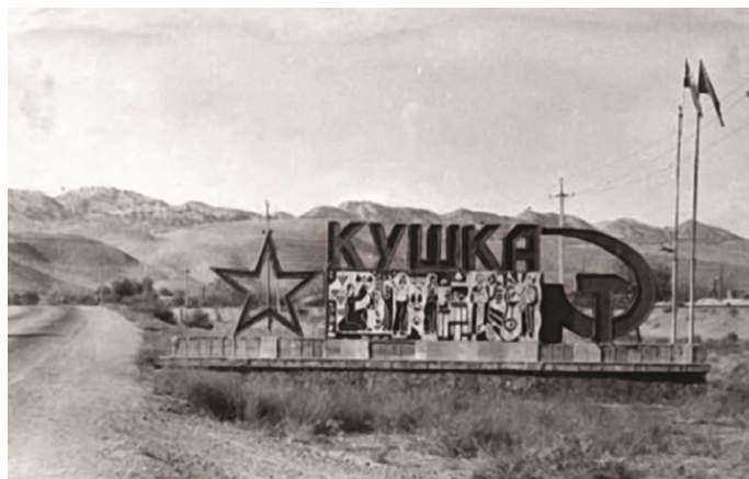
Кушка. До 1979 года дальше ее не посылали

Мороз ощутимо щиплет уши. Вот тебе и самая южная точка страны! Стоило ехать с севера, чтобы отморозить уши на юге? С трудом узнаю заснеженный город. Я уже был здесь три года назад, летом, на курсантской стажировке. Вот уж не думал, что вновь доведется! Древняя армейская поговорка: «Меньше взвода не дадут, дальше Кушки не пошлют» устарела: еще как пошлют!