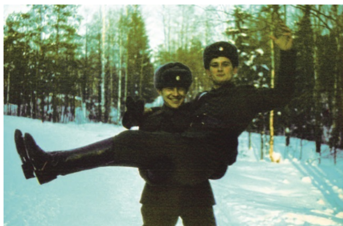
Через несколько месяцев – Афганистан

И вот сонная монотонность гарнизонной жизни внезапно оборвалась. Все, что только недавно всецело занимало умы и языки местных кумушек, было мгновенно забыто. Рейтинг походов очередной местный Дон Жуана упал безвозвратно. Что-то явственно назревало. Романисты в такой ситуации обычно пишут: «В воздухе запахло грозой». И действительно, в городке ощутимо повеяло каким-то тревожным холодком. Вроде ничего не изменилось, но все чувствовали: что-то будет.