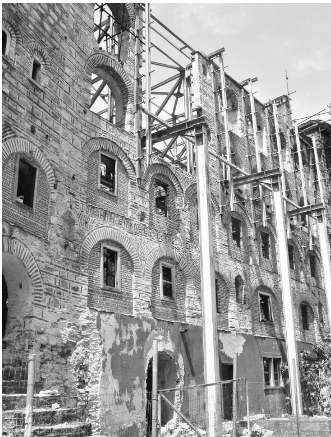
Работа «пиратов» XXI века