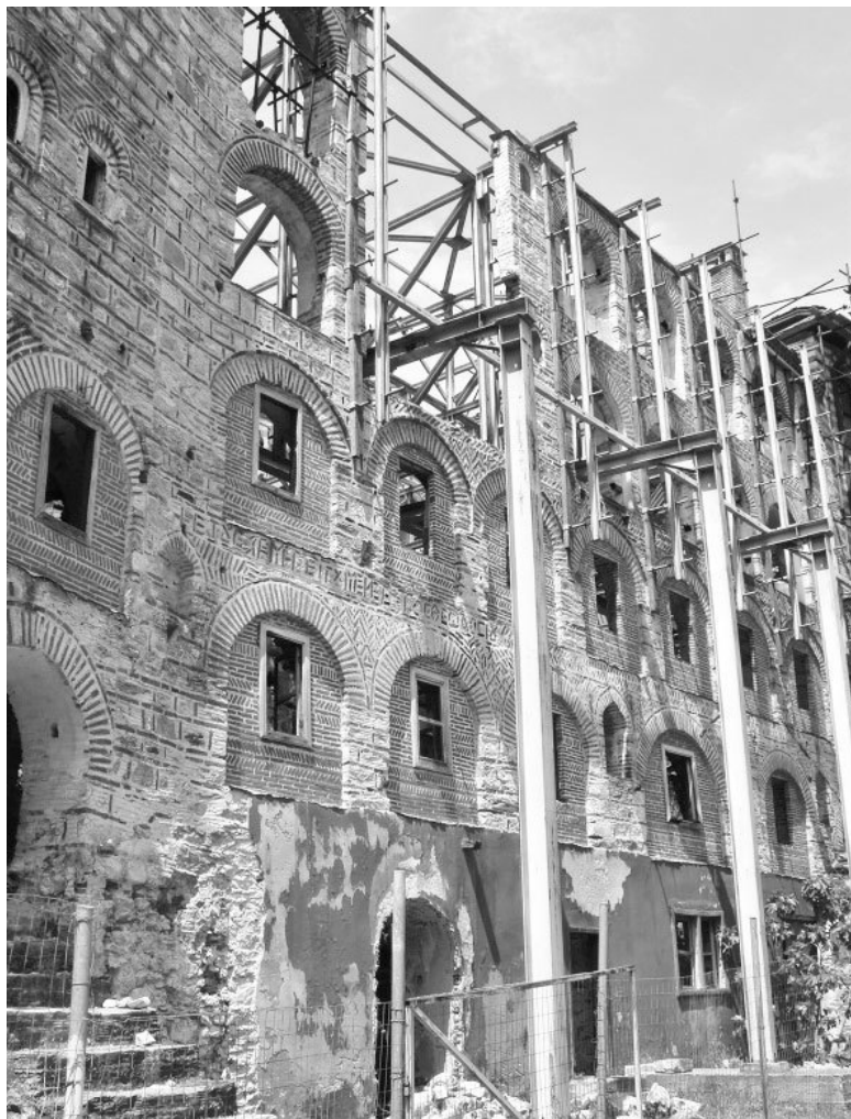
Работа «пиратов» XXI века