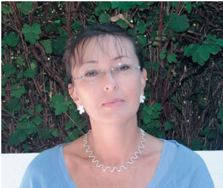
ВАЛЕРИЙ ДУДАРЕВ, поэт, Главный редактор журнала «Юность»