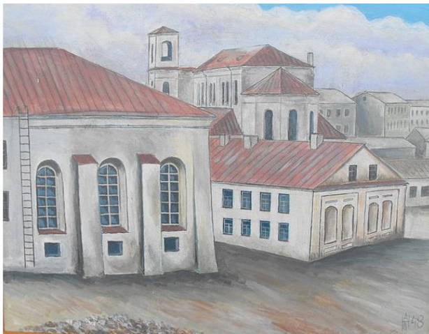
«Холодная» синагога, ниже – хедер на Немиге Минск, 1948 год. Художник А. Наливаев

Соседняя с нашей улицей, «Нямига» с «Холодной» (большой) синагогой, была местом плотного проживания минской еврейской диаспоры, с которой мы соседствовали и всегда тесно общались. А до революции дед туда приезжал купить, как он говаривал, «колониальный товар», например, ананас.