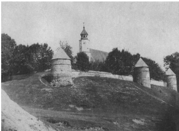
Кальвинистский собор («збор» бел. яз.) в Койданово (ныне Дзержинск) фото 1930 года